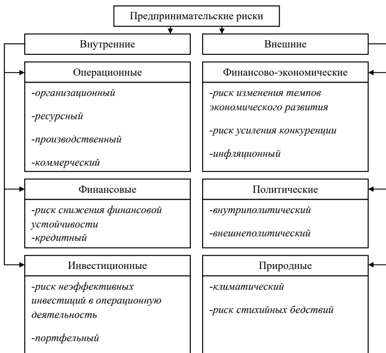
Рис. 1.1. Структура предпринимательских рисков

В работе [24] приводится классификация предпринимательских рисков на основе ведения коммерческой деятельности.