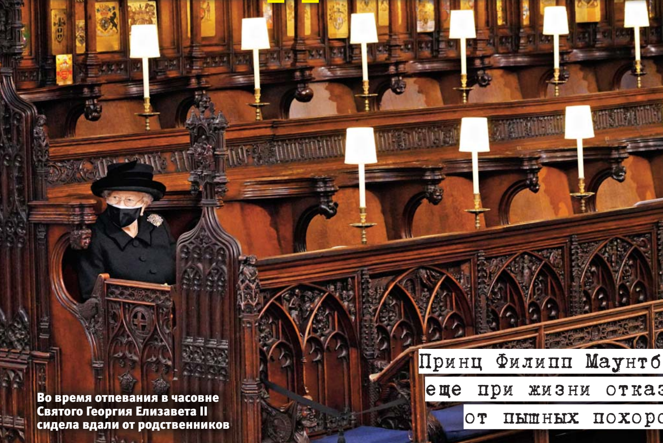
Во время отпевания в часовне Святого Георгия Елизавета II сидела вдали от родственников