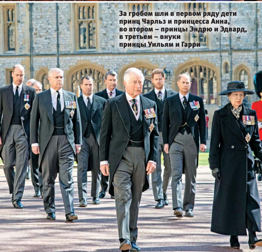
За гробом шли в первом ряду дети принц Чарльз и принцесса Анна, во втором – принцы Эндрю и Эдвард, в третьем – внуки принцы Уильям и Гарри

Принц Филипп Маунтбеттен еще при жизни отказался от пышных похорон