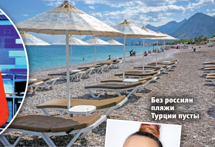
Без россиян пляжи Турции пусты