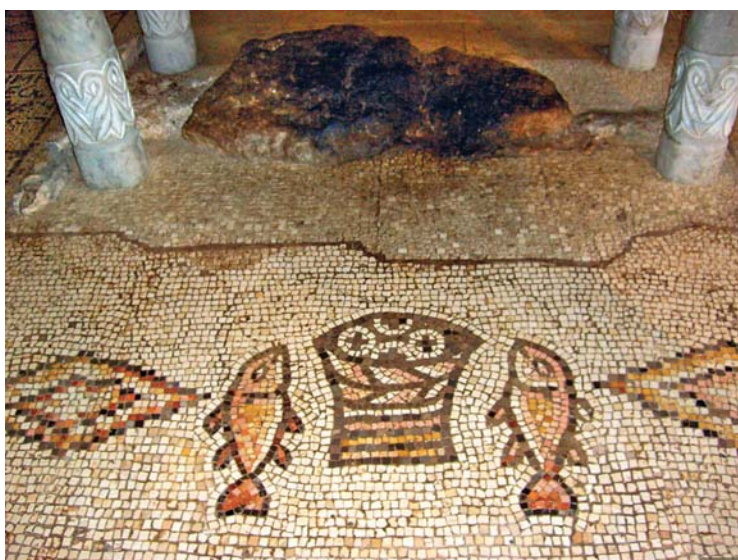
Хлеба и рыбы. Мозаика церкви Умножения хлебов и рыб в Табхе, Израиль. V в.

Беседа о небесном хлебе построена по тому же принципу, по которому строились многие беседы Иисуса с приходившими к Нему людьми. Иисусу было свойственно переключать внимание собеседника с предметов