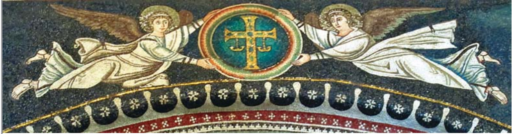
Орнамент с изображением «небесных хлебов». Ангелы, несущие хризмон. Мозаика базилики Сан-Витале в Равенне. 546–547 гг.

брат брата, и говорить: «познайте Господа», ибо все сами будут знать Меня, от малого до большого, говорит Господь, потому что Я прощу беззакония их и грехов их уже не вспомяну более (Иер. 31:31–34).