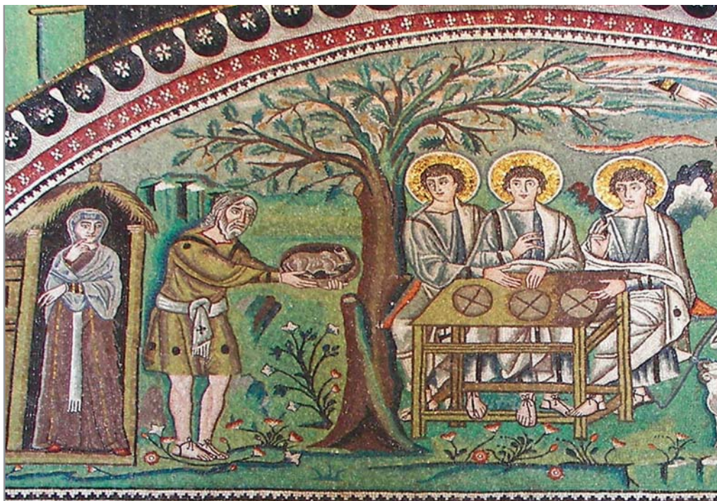
Гостеприимство Авраама. Мозаика базилики Сан-Витале в Равенне. 546–547 гг.

оскудение в земле Ханаанской и наличие в земле Египетской заставляют сыновей Иакова прийти к своему брату Иосифу. Выбор между хлебом и его отсутствием был выбором между жизнью и смертью: