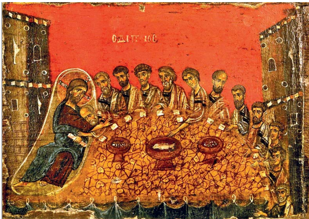
Тайная вечеря. Икона. Византия. XII в. Монастырь Ватопед на Афоне

хлеба» станет основой литургического бытия церковной общины (Деян. 2:42, 46). Для первых христиан этот опыт будет неразрывно сопряжен с опытом мученичества — предания собственной плоти на смерть и пролития собственной крови. Во II веке приговоренный к смерти Антиохийский епископ Игнатий, идя в Рим, где его ожидает казнь, напишет римским христианам: