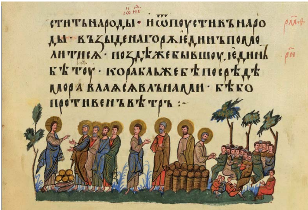
Насыщение народа пятью хлебами. Хождение по водам. Миниатюра из Четвероевангелия царя Иоанна Александра. 1356 г. (Британская библиотека, Лондон. Add MS 39627)

И, найдя Его на той стороне моря, сказали Ему: Равви! когда Ты сюда пришел? Иисус сказал им в ответ: истинно, истинно говорю вам: вы ищете Меня не потому, что видели чудеса, но потому, что ели хлеб и насытились. Старайтесь не о пище тленной, но о пище, пребывающей в жизнь вечную, которую даст вам Сын Человеческий, ибо на Нем положил печать Свою Отец, Бог. Итак сказали Ему: что нам делать, чтобы творить дела Божии? Иисус сказал им в ответ: вот