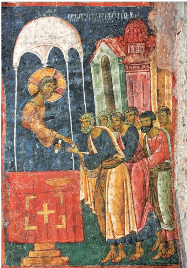
Причащение апостолов. Фреска в церкви св. Апосто- лов в Печской Патриархии. XIII в.

лия не говорит о каком-то идеальном мире. С первых страниц она повествует о мире, населенном людьми и животными — о мире, в котором для поддержания жизни каждому живому