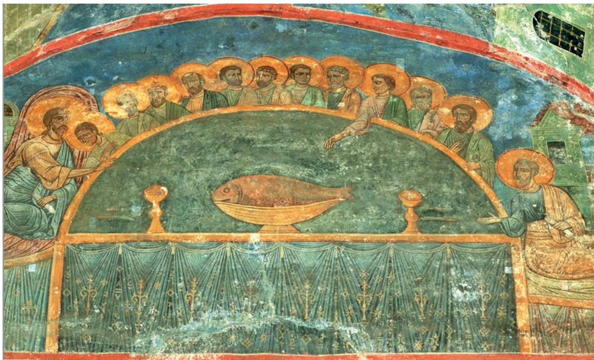
Тайная вечеря. Фреска Спасо-Преображенского Мирожского монастыря во Пскове. Рубеж 30-х и 40-х гг. XII в.

С другой стороны, в обеих традициях есть немало общих пунктов 1 . Два пункта являются общими для Иоанна и трех синоптиков: предсказание о предательстве Иуды (Мф. 26:20–25; Мк. 14:17–21; Лк. 22:22–23; Ин. 13:18–19, 21–30) и предсказание об отречении Петра (Мф. 26:33; Мк. 14:29–31; Лк. 22:31–34; Ин. 13:38). Во всех четырех Евангелиях упоминается плод виноградной лозы, хотя у Иоанна (Ин. 15:1–6) это упоминание помещено в иной контекст, чем у синоптиков (Мф. 26:29; Мк. 14:25; Лк. 22:18). Тема новой заповеди у Иоанна (Ин. 13:34; 15:12, 17) перекликается с темой Нового Завета у синоптиков (Мф. 26:28; Мк. 14:24; Лк. 22:20), хотя, опять же, общий контекст отличен.