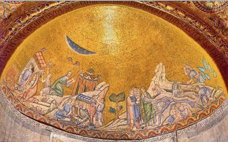
Чудо о перепеллах. Схождение манны небесной. Мозаика базилики Сан-Марко в Венеции. XII в.

лежала роса около стана; роса поднялась, и вот, на поверхности пустыни нечто мелкое, круповидное, мелкое, как иней на земле. И увидели сыны Израилевы и говорили друг другу: что это? Ибо не знали, что это. И Моисей сказал им: это хлеб, который Господь дал вам в пищу». Каждому полагалось по гомору на человека 1 , при этом не разрешалось оставлять запас на следующий день. В канун субботы выпадала двойная норма, чтобы на следующий день народ мог соблюдать заповедь субботнего покоя. «И нареком Израилев хлебу тому имя: манна 2 ; она была, как кориандровое семя, белая, вкусом же как лепешка с медом». Сыны Израилевы питались манной сорок лет, пока не пришли в Землю обетованную (Исх. 16:1–35).