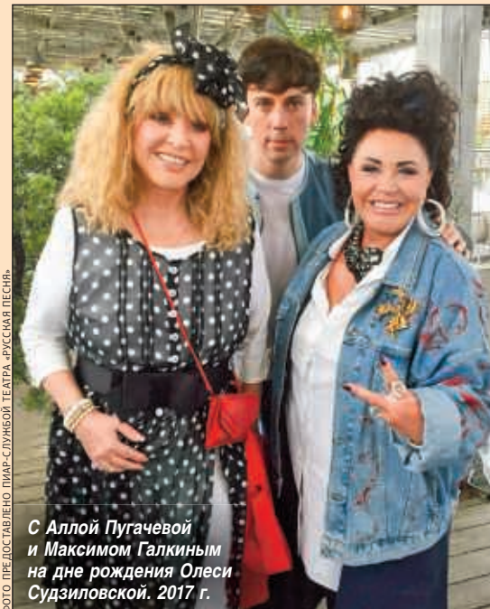
С Аллой Пугачевой и Максимом Галкиным на дне рождения Олеси Судзиловской. 2017 г.

— Конечно. Когда я вышла из комы, одними из первых мне позвонили со словами поддержки Макс Галкин и Алла Пугачева. Сиделка, которая помогала мне восстанавливаться — а я в то время элементарно не могла держать телефонную трубку, — ушам своим не поверила, услышав голос Пугачевой. Просто замерла в священном трепете! А если говорить о дружбе с коллегами, самыми близкими друзьями я бы назвала