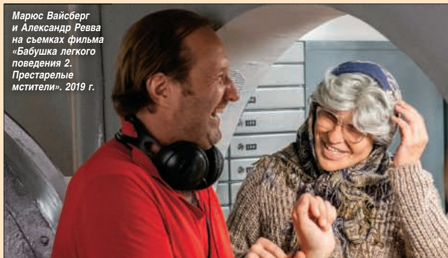
Марюс Вайсберг и Александр Ревва на съемках фильма «Бабушка легкого поведения 2. Престарелые мстители». 2019 г.