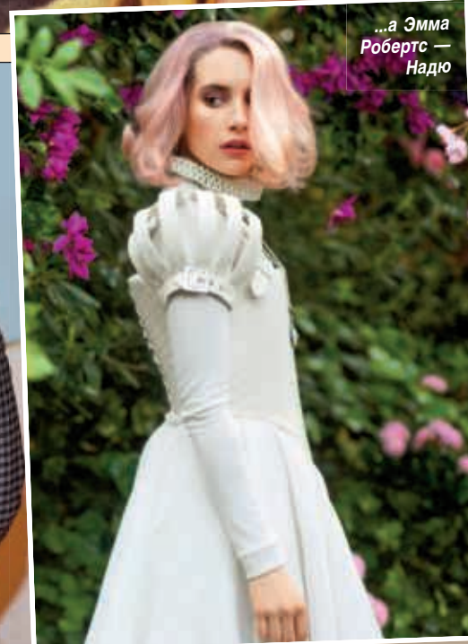
...а Эмма Робертс — Надю