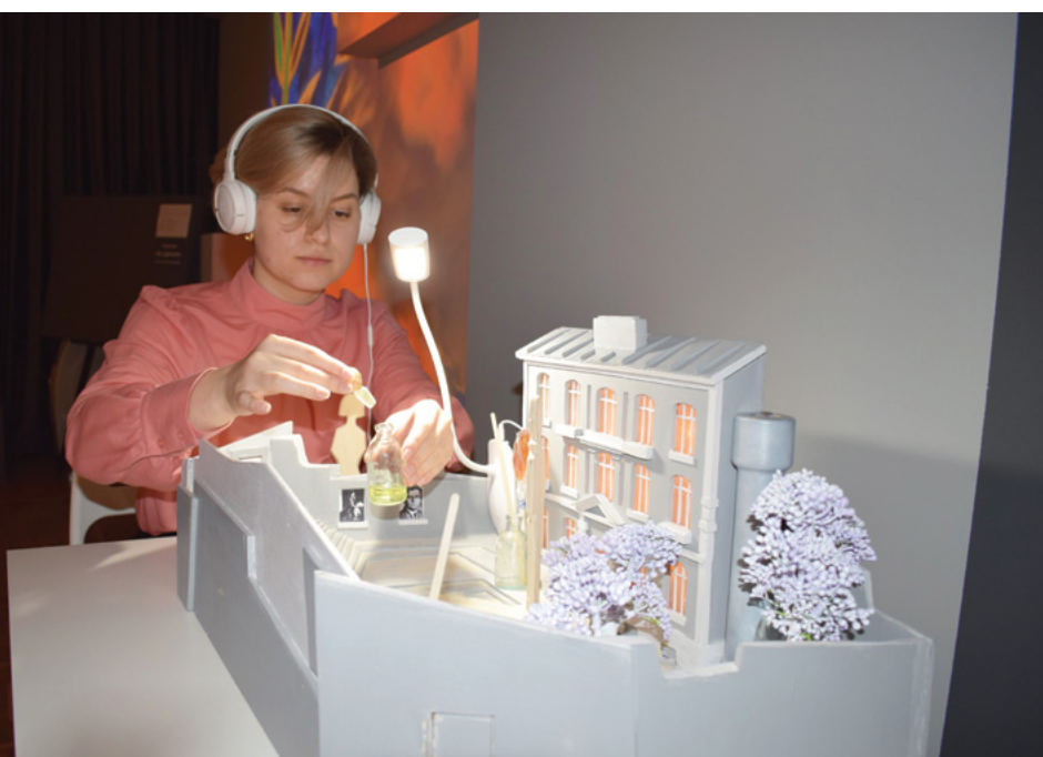
Миниатюрная копия мастерской Гончаровой и Ларионова в Трехпрудном переулке. Ручная работа.