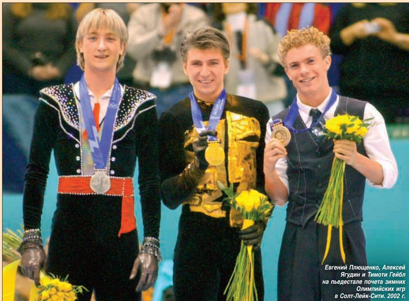
Евгений Плющенко, Алексей Ягудин и Тимоти Гейбл на пьедестале почета зимних Олимпийских игр в Солт-Лейк-Сити. 2002 г.