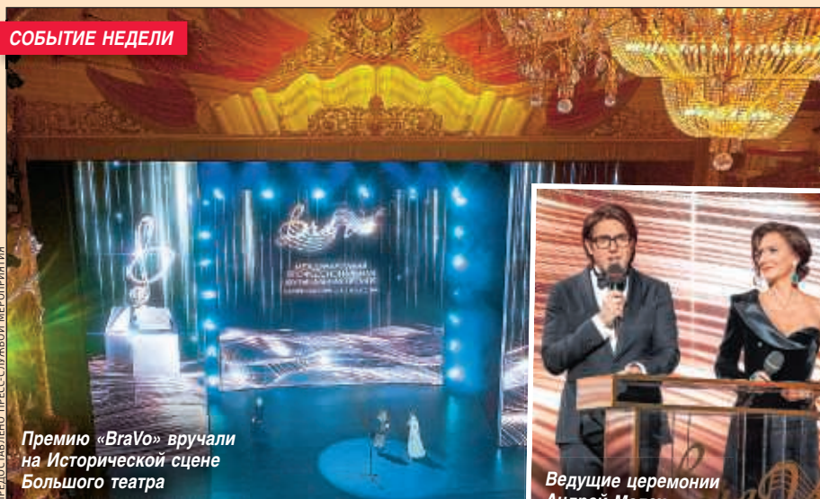
Премии «BraVo» вручали на Исторической сцене Большого театра