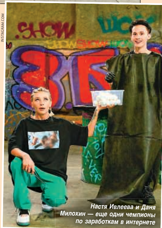
Настя Ивлеева и Данила Милохин — еще одни чемпионы по заработкам в интернете