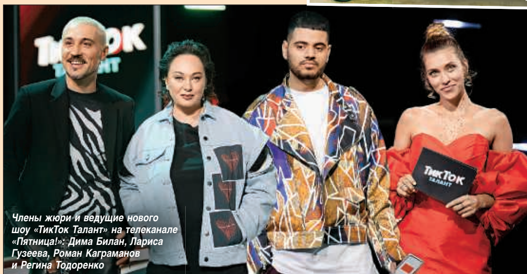
Члены жюри и ведущие нового шоу «ТикТок Талант» на телеканале «Пятница!»: Дима Билан, Лариса Гузеева, Роман Каграманов и Регина Тодоренко