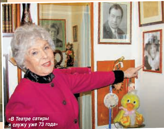
«В Театре сатиры я служу уже 73 года»