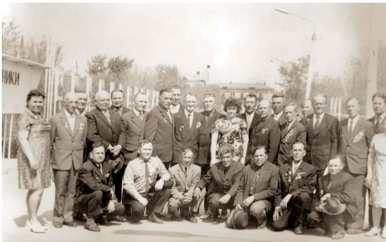
Учителя и директора школ города и района — участники Великой Отечественной войны. Май 1975 год. 30 лет Победы в Великой Отечественной войне