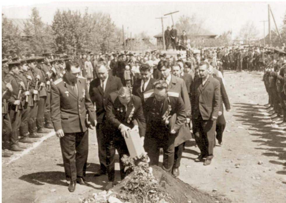
Закладка плиты у памятника «Славы». 09.05.1967 года