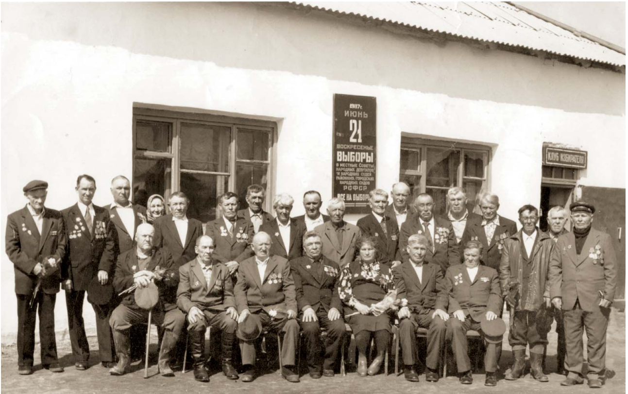
Ветераны Великой Отечественной войны — жители с. Неплюевка. 1987 г.