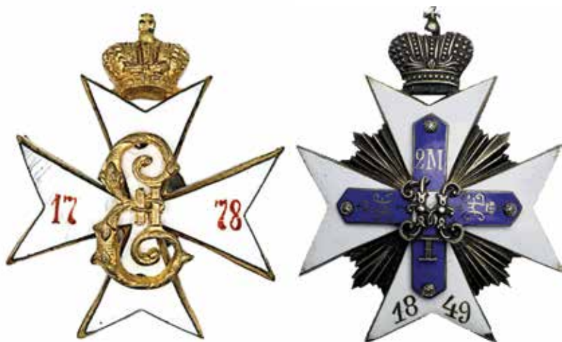
Нагрудные знаки 1-го и 2-го Московских кадетских корпусов