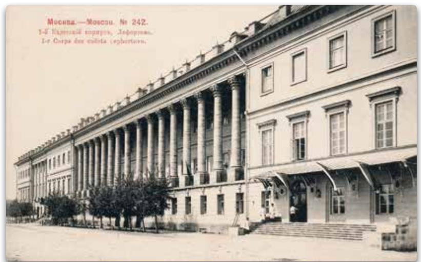
1-й Московский кадетский корпус