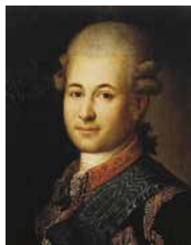
Семен Гаврилович Зорич

1732-го открыт Корпус кадет шляхетских детей (с 1743-го — Сухопутный шляхетский кадетский корпус, с 1800-го — 1-й кадетский корпус).