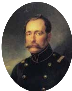
Великий князь Михаил Павлович

В 1836 году великий князь Михаил Павлович, главный начальник военно-учебных заведений, ввел для кадетских корпусов новый устав, основанный на указании императора Николая I: «Воспитанник <...> должен стать христианином, верноподданным, добрым сыном, надежным товарищем, скромным и образованным юношей, исполнительным, терпеливым и расторопным офицером» 16 . Учебные предметы в кадетских корпусах распределили по классам и разделили на три курса: подготовительный (2 года), общий (4 года) и специальный (2 года) 17 . Преподавались «в классах подготовительных — начатки Закона Божия, чтение и письмо по-русски, по-французски и по-немецки, начала арифметики, чистописания и рисования; в классах же общих и специальных — Закон Божий, русский язык и словесность, те же два иностранных языка, арифметика, алгебра, геометрия, тригонометрия, аналитическая геометрия, механика, естественная история, физика, химия,