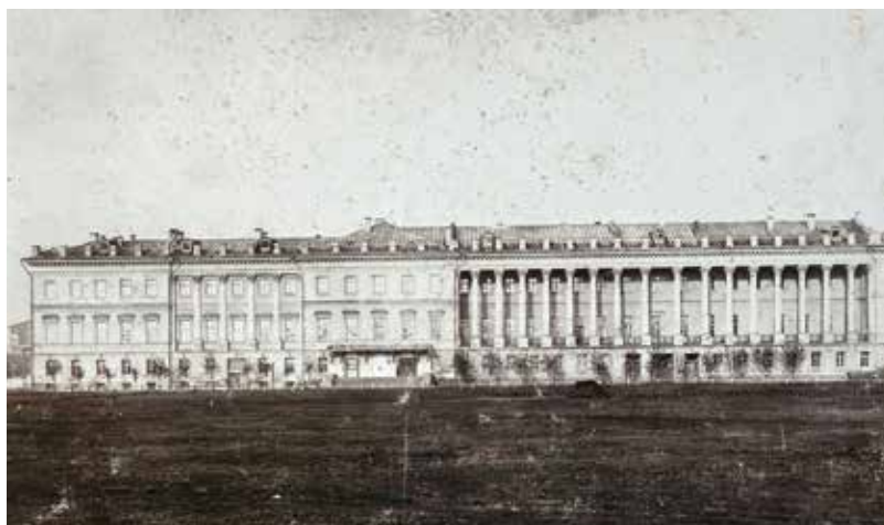
Здание 1-го Московского императрицы Екатерины II кадетского корпуса. 1905—1910 годы

ства в Москве еще одного кадетского корпуса, который был учрежден 6 декабря того же года и получил название 2-й Московский кадетский корпус 23 . Соответственно, существующий корпус стал 1-м Московским. Разместить вновь созданный корпус решили также в Екатерининских казармах. Однако работы по приспособлению здания для