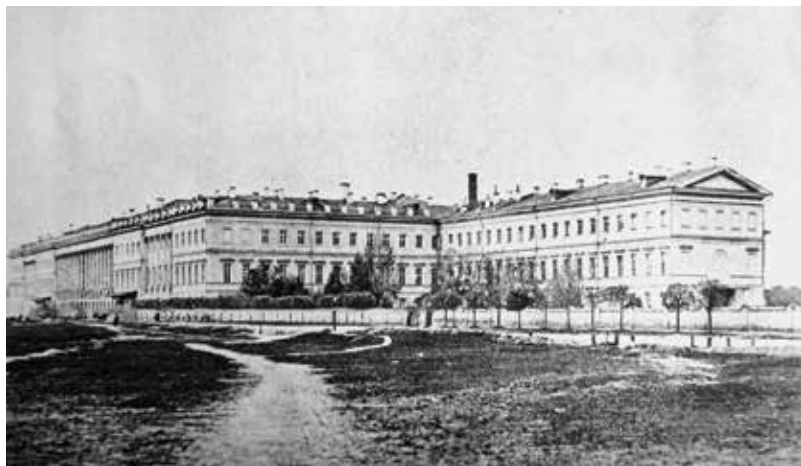
Здание 2-го Московского императора Николая I кадетского корпуса. 1899 год

В 1837 году государь поручил главному начальнику военно-учебных заведений великому князю Михаилу Павловичу составить проект устрой-