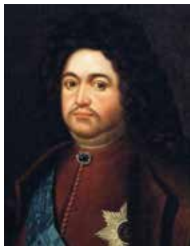
Федор Алексеевич Головин

ско Кампорези — в период с 1773 по 1796 год отстроили каменный дворец, сохранившийся до наших дней. Именно в Екатерининском дворцовом комплексе в XIX веке были расквартированы 1-й, 2-й и 3-й (бывший 4-й) Московские кадетские корпуса 2 .