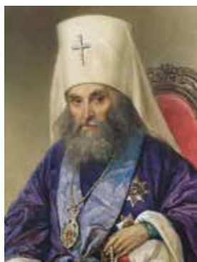
Митрополит Московский и Коломенский Филарет (Дроздов)

Некоторое время в Москве существовал Александринский сиротский кадетский корпус, преобразованный указом императора Николая I от 27 января 1850 года из Александринского сиротского института 29 по образцу столичных корпусов. Когда в 1850 году Сиротский институт был закрыт для переустройства помещений под кадетский корпус, 200 его воспитанников пополнили состав 2-го Московского кадетского корпуса — из них сформировали гренадерскую и мушкетерскую роты. После упразднения Александринского сиротского кадетского корпуса (1863) александринцы продолжили обучение в 1-м и 2-м Московских кадетских корпу-