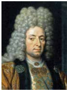
Франц Яковлевич Лефорт

Она связана с именем и другого выдающегося деятеля петровской эпохи — генерал-фельдмаршала Федора Алексеевича Головина (1650–1706). Здесь находилась его усадьба. В начале 1720-х годов Петр I выкупил ее у наследников Головина и начал благоустраивать под свою резиденцию. Затем императрицы Анна Иоанновна и Елизавета Петровна возводили на этом месте деревянные дворцы по своему вкусу. И наконец, для императрицы Екатерины II знаменитые зодчие — Антонио Ринальди, Карл Бланк, Джакомо Кваренги и Франче-