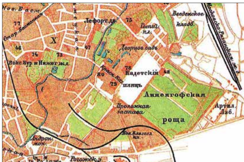
Анненгофская роща на карте 1895 года

В 1831 году воспитанников Московского кадетского корпуса во время летних каникул впервые вывезли в лагерь на Анненгофском поле, расположенном между зданием корпуса и Анненгофской рощей 14 . Со следующего года их стали вывозить на лето в местность, лежащую между селом Коломенским и деревней Нагатино 15 .