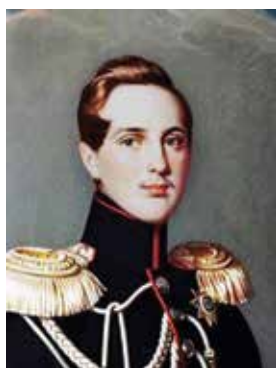
Цесаревич Александр Николаевич