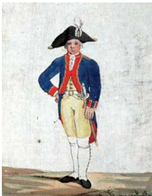
К. Г. Гейслер. Мундир кадета Сухопутного шляхетного кадетского корпуса. 1793 год

Указом императрицы Анны Иоанновны от 29 июля 1731 года в Санкт-Петербурге был учрежден, а 17 февраля