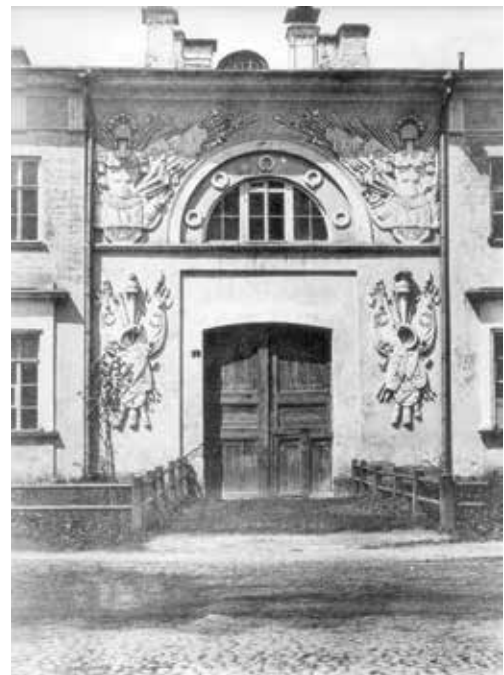
Ворота в здании 3-го Московского императора Александра II кадетского корпуса. Начало XX века.

4-й Московский кадетский корпус размещался в Лефортове в здании Красных казарм — бывшем служебном флигеле Екатерининского дворца. Старшинство свое он вел от Московской военной прогимназии, учрежденной 6 июля 1868 года и преобразованной 9 июля 1876-го в 4-ю Московскую военную гимназию 30 . 22 июля 1882-го после преобразования всех военных гимназий в кадетские корпуса гимназия стала 4-м Московским кадетским корпусом. С упразднением 3-го Московского кадетского корпуса на Спиридоновке (см. выше) 4-й корпус 31 августа 1892 года переименовали в 3-й. Таким образом, три московских кадетских корпуса вплоть до револю-