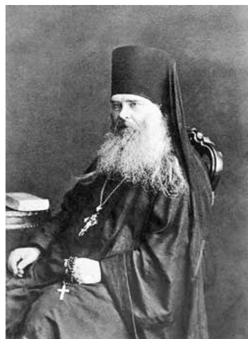
Архимандрит Леонид (Кавелин)

Сохранились воспоминания о нем воспитанника корпуса (1835–1840), а впоследствии наместника Свято-Троицкой Сергиевой лавры архимандрита Леонида (Кавелина): «Урок его мы ждали, как голодные — пищи, жаждущие — питья, <...> и когда по заведенному порядку барабанная