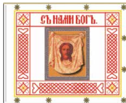
Знамя 3-го Московского кадетского корпуса

В 1903 году знамена были пожалованы 11 до того их не имевшим кадетским корпусам, в том числе и 3-му Московскому 36 . Его знамя «состояло из двух сшитых шелковых полотнищ с вытканною иконою Нерукотворенного Образа Господа нашего Иисуса Христа» 37 . Однако вручение знамени состоялось лишь 6 февраля 1906 года. Причиной отсрочки послужили беспорядки в корпусе, произведенные ранее воспитанниками 7-го класса. Зачинщиков отчислили, остальных подвергли дисциплинарным взысканиям 38 .