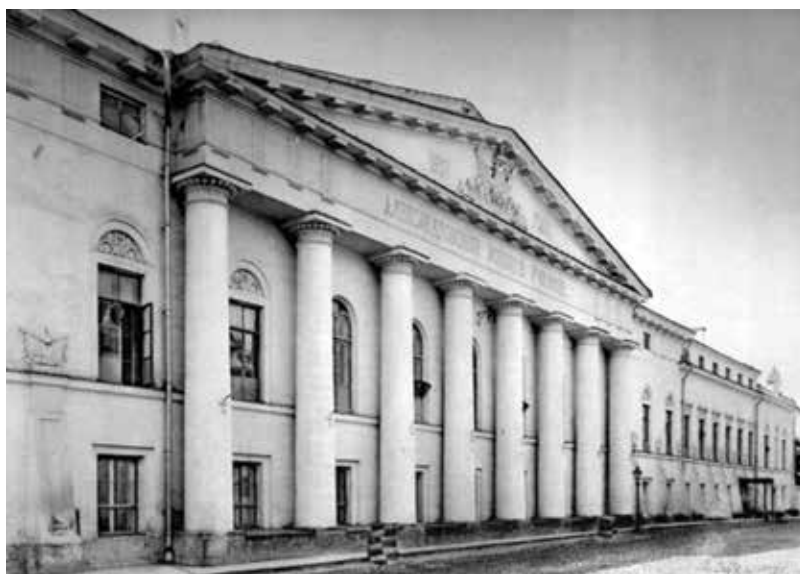
Александровское военное училище

сах, а в его здании на Знаменской улице открылось Александровское военное училище.