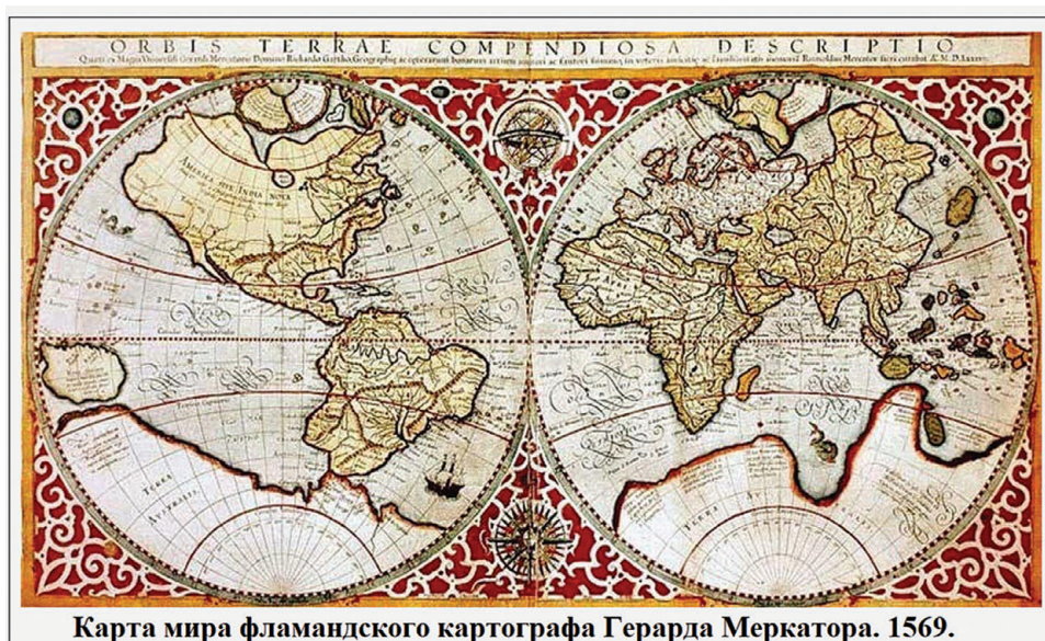
Карта мира фламандского картографа Герарда Меркатора. 1569.

В раннее Новое время (конец XV–XVII в.) европейские страны постепенно стали лидировать в общественно-политическом и экономическом развитии в сравнении с государствами Азии и Америки и начинают всё решительнее