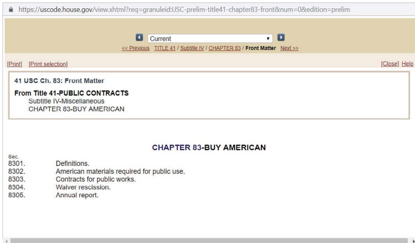
Рис. 2. Закон «Покупай американское» в Своде законов США

На рис. 2 продемонстрирована структура Закона «Покупай американское» на официальном сайте Свода законов США.