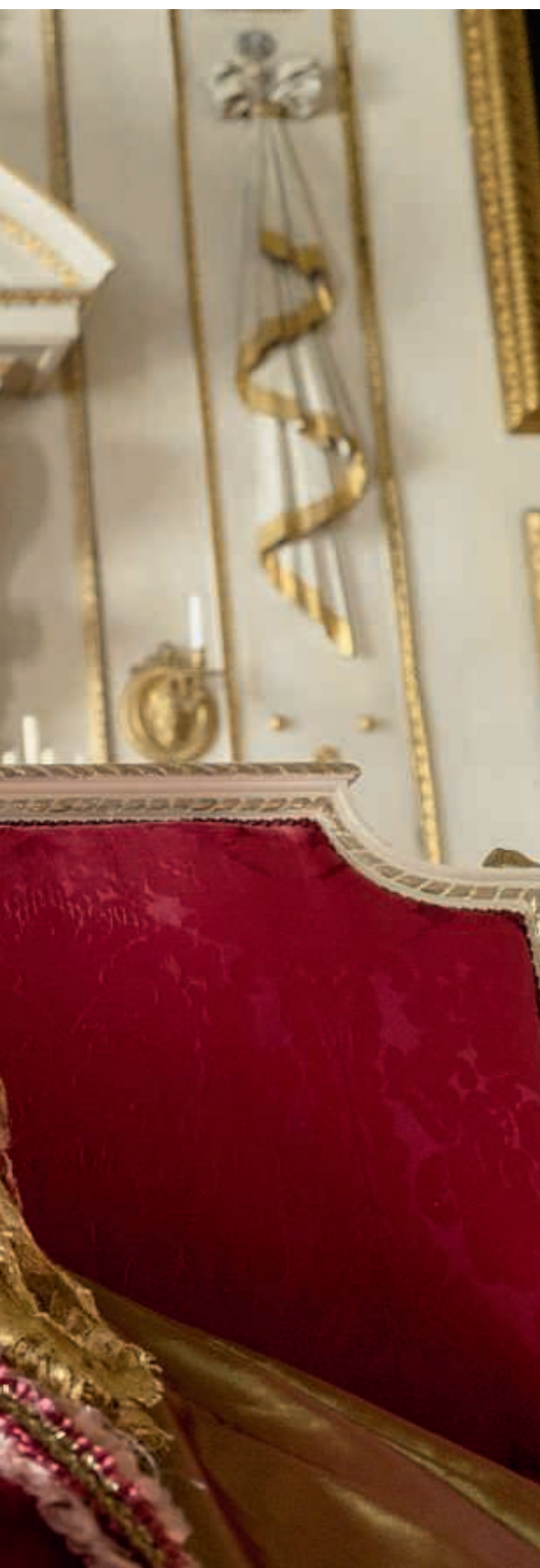
ФОТО: ЛАМ ДАНИЕЛ/NETFLIX/THE HOLLYWOOD ARCHIVE/EAST NEWS/КАДР ИЗ СЕРИАЛА «БРИДЖЕРТОННЫ»