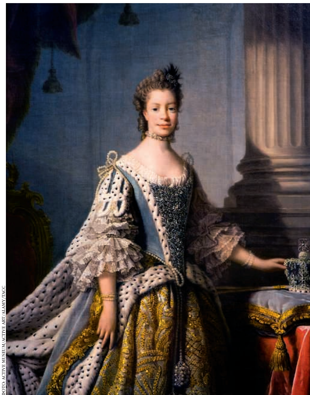
ФОТО: ACTIVE MUSEUM/ACTIVE ART/ALAMY/ТАСС

ФОТО: ЛАМ ДАНИЕЛ/NETFLIX/THE HOLLYWOOD ARCHIVE/EAST NEWS/КАДР ИЗ СЕРИАЛА «БРИДЖЕРТОННЫ»