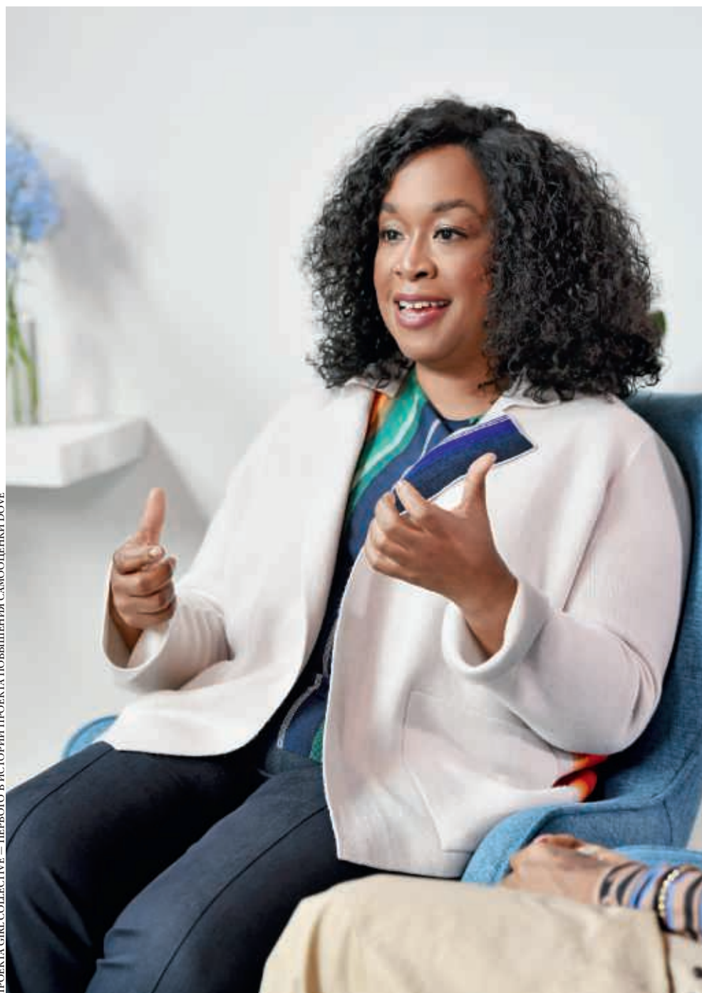
НА МЕРОПРИЯТИИ DOVE, ПОСВЯЩЕННОМ ЗАПУСКУ ПРОЕКТА GIRL COLLECTIVE — ПЕРВОГО В ИСТОРИИ ПРОЕКТА ПОВЫШЕНИЯ САМООЦЕНКИ DOVE

Шонда Раймс на сегодняшний день, пожалуй, самый известный телепродюсер и шоураннер — с Netflix у нее заключен контракт на сто пятьдесят миллионов долларов