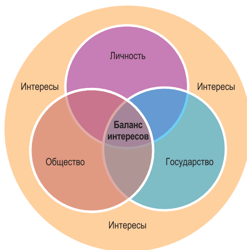
Рис. 2. Структурно-логическая схема баланса интересов личности, общества и государства

и внешних угроз. В свою очередь, национальные интересы — это совокупность потребностей государства по реализации сбалансированных интересов личности, общества и государства, позволяющих обеспечивать конституционные права, свободы, высокое качество жизни граждан, независимость, территориальную целостность, суверенитет и устойчивое развитие Республики Беларусь. То есть, не интересы указанных субъектов вообще. Они различаются и не всегда совпадают. Поэтому необходимо поддержание взвешенного, гармоничного баланса интересов личности, общества и государств, и этот баланс не может быть статичным, он всегда подвижен (рис. 2).