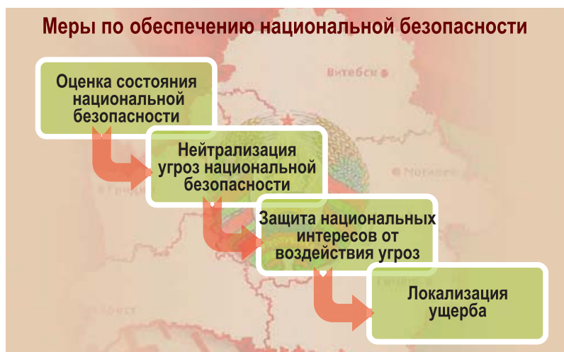
Рис. 5. Алгоритм реализации мер по обеспечению национальной безопасности

Предлагаемые показатели характеризуют в доступной и наглядной форме текущий уровень и динамику изменения ситуации в различных сферах национальной безопасности. Общий алгоритм реализации мер по обеспечению национальной безопасности Республики Беларусь представлен на рис. 5.