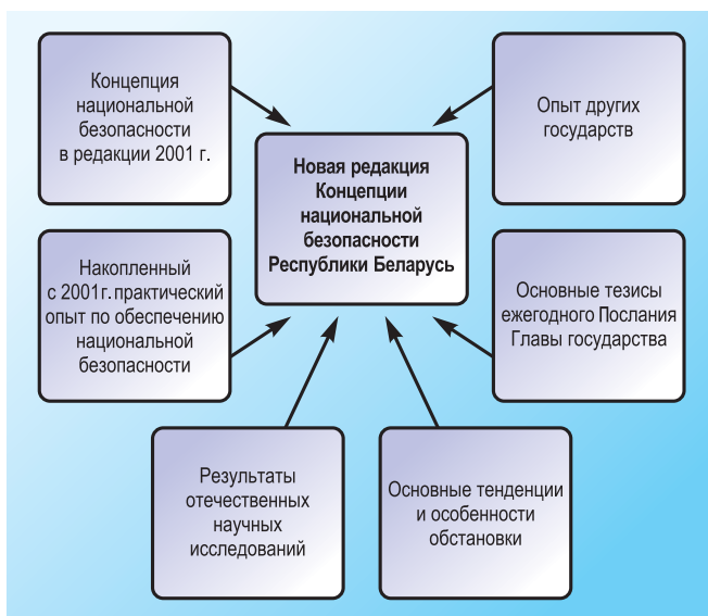
Рис. 1. Основа Концепции национальной безопасности 2010 г.

и внешних угроз. В свою очередь, национальные интересы — это совокупность потребностей государства по реализации сбалансированных интересов личности, общества и государства, позволяющих обеспечивать конституционные права, свободы, высокое качество жизни граждан, независимость, территориальную целостность, суверенитет и устойчивое развитие Республики Беларусь. То есть, не интересы указанных субъектов вообще. Они различаются и не всегда совпадают. Поэтому необходимо поддержание взвешенного, гармоничного баланса интересов личности, общества и государств, и этот баланс не может быть статичным, он всегда подвижен (рис. 2).