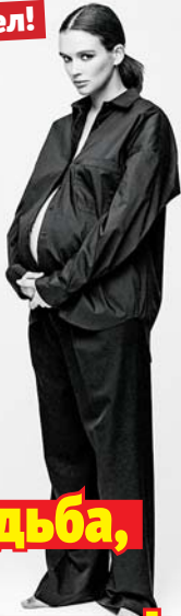
Федор Бондарчук и Паулина Андреева

Сначала – тайная свадьба, теперь – секретные роды!