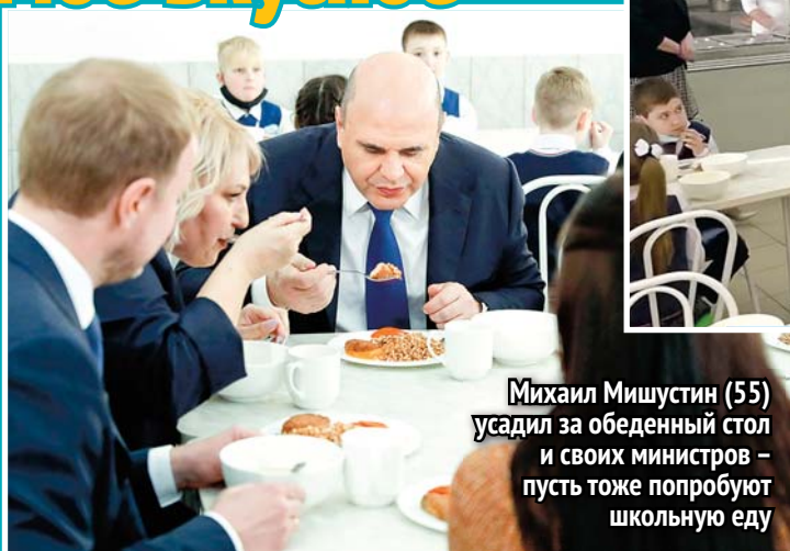
Михаил Мишустин (55) усадил за обеденный стол и своих министров – пусть тоже попробуют школьную еду

ских котлетках и пирожках у него счастливые! Потому глава правительства и озабочен тем, чтобы нынеш-