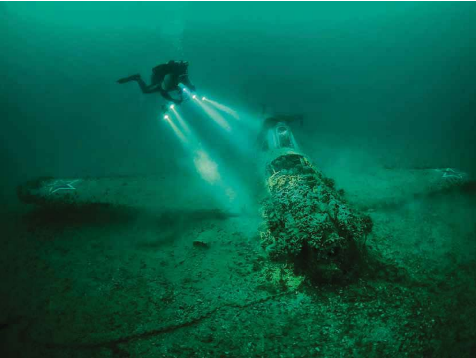
Фото: Дмитрий Виноградов