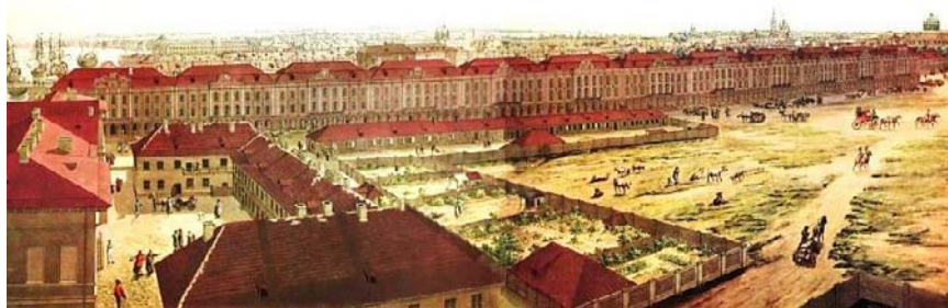
Рис. 3. Санкт-Петербург. Здание Двенадцати коллегий. Архитектор Д. Трезини. 1722–1723 гг.

войти в ансамбль проектируемой площади на стрелке Васильевского острова. Простота плана составляет его характерную особенность. Петр I предложил все учреждения Сената, Синода и коллегий расположить в двенадцати зданиях и из экономических соображений строить их постепенно, пристраивая одно здание к другому. Это указание было учтено в проекте Д. Трезини, по которому коллегии располагались в отдельных зданиях, соединенных в одно целое. Каждое из них было покрыто четырехэтажной крышей с характерным изломом над чердачным этажом, завершенным в центре живописным по форме аттиком с волютами, нишами и гирляндами. Первый этаж главного фасада имел открытую галерею, позже застекленную. Соответственно назначению, здание скромно и сурово. Некоторую живописность придавали ему красивого рисунка решетки балконов, кронштейны и аттики над входом в каждую коллегию (рис. 3).