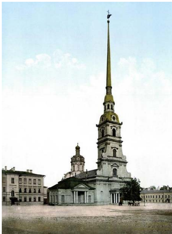
Рис. 2. Санкт-Петербург. Петропавловский собор. Архитектор Д. Трезини. 1712–1733 гг.

Д. Трезини (около 1670–1734). Петровский собор (1712–1733) – одно из самых знаменитых произведений архитектора, построенное на Васильевском острове и ставшее доминантой новой столицы (рис. 2).