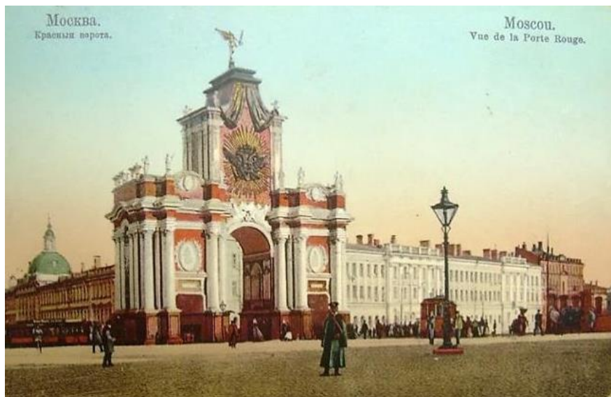
Рис. 1. Москва. Ништадские (Красные) ворота. 1721 г.

Выполненные в стиле барокко иконостасы сохранились в Преображенском соборе в Таллине и в Петропавловском соборе в Санкт-Петербурге. В этом направлении работал архитектор Иван Петрович Зарудный (1670–1727), ему приписывается авторство постройки церкви Иоанна Воина на Якиманке (1709–1713). Палаты Аверкия Кириллова имеют подобное сочетание форм.