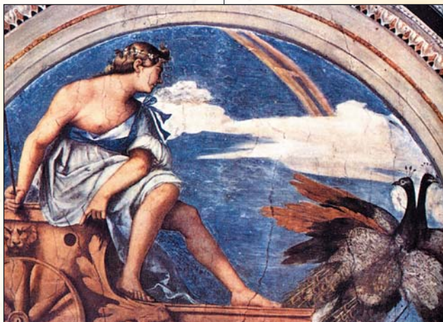
▲ Себастьяно дель Пьомбо. Юнона. XVI в.