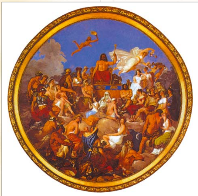
▲ Луиджи Сабателли. Боги Олимпа. XIX в.

война) функции. (Согласно Э. Дюркгейму, французскому социологу, боги — это олицетворение социальных сил, действующих на человека, но непонятных ему.) В теизме акцентируется личностный статус Бога, Он наделяется атрибутами вечности, совершенства, независимости, неизменности, всеведения, благодати, святости, беспредельного могущества, правосудия.