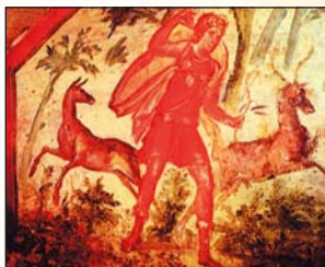
▲ Артемиды-охотница. Римская фреска. IV в.

В развитых религиозно-мифологических традициях боги наделяются прежде всего мирозозидающими и мироустроительными функциями. В язычестве Бог представляет собой не столько персону, сколько персонификацию, в структуре которой личностное начало отходит на второй план по сравнению с образом той или иной стихии (Фетида — воплощение моря, Гея — земли, Аполлон, или Гелиос — солнца и т. п.) или — позднее — соответствующей хозяйственной (Асклепий — врачевания, Артемиды — охоты, Гефест — кузнечного дела и т. п.) либо социальной (Дике — справедливость, Фемида — правосудие, Марс —