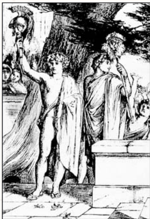
▲ Близнецы Рем и Ромул

В большинстве мифологических традиций выделяются так называемые близнецные мифы, повествующие о персонажах-близнецах. К числу последних относятся ведийские божественные Ашвины — Митра и Варуна; римские герои Ромул и Рем; египетские боги Исида и Осирис; греческие боги Аполлон и Ар-