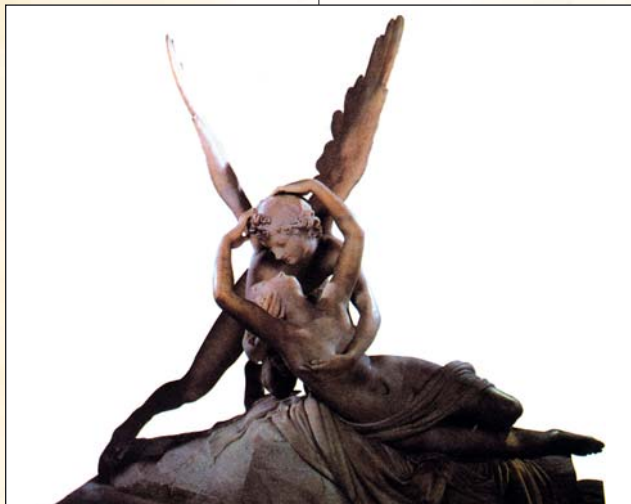
▲ Амур и Психея

лась в виде бабочки либо девушки с крыльями бабочки (в переводе с греческого слово «психе» означает одновременно «душа», «дыхание» и «бабочка»). Считалось, что после смерти человека душа-бабочка вылетает из погребального костра