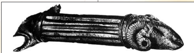
▲ Рукоятка жертвенной миски

ми, или же овцами, называются также в Библии люди грешные и слабые верою — они уподобляются пастве, идущей за пастырем. И в этом контексте Иисус характеризуется как «пастырь добрый», «полагающий жизнь свою за овец» (Ин. 10).