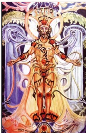
▲ Адам Кадмон

В качестве человека-вселенной Адам Кадмон связы-