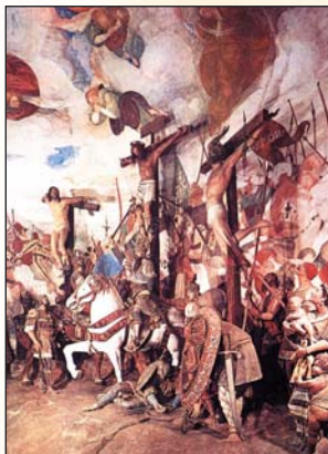
▲ Гауденцио Феррари. Голгофа. XVI в.

Адам объединял в себе и земное, и божественное начала. Согласно библейским преданиям, он был создан из двух частей — земного праха и божественного дыхания (подобный мотив существует и в других традициях — так, например, в вавилонской мифологии бог Мардук сотворил первого человека из глины и своего дыхания).