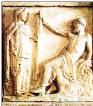
▲ Священный брак Зевса и Геры. Метопы храма Геры в Селинунте. V в. до н. э.

В самом широком смысле брак выступает как символ завершенности, целостности, полноты (аналогичным значением наделяется, впрочем, и гермафродитизм).