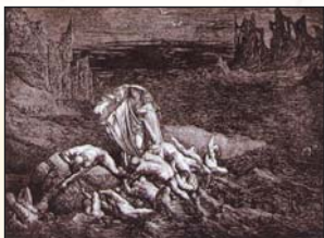
▲ Г. Доре. Стигийское болото

вана двумя антагонистическими духу стихиями, она символизирует искус материальным, поддавшись которому, человек обрекает себя на гибель. В целом, в связи с символикой стихий, болото предстает как элемент ландшафта, в котором ощущается недостаток двух активных (воздуха и огня) и избыток двух пассивных начал (воды и земли). В славянской мифологии болото является символом смерти (туда в заговорах «ссылаются» все болезни и смерть).