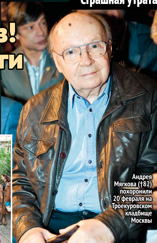
Андрей Мягкова (†82) похоронили 20 февраля на Троекуровском кладбище Москвы

В «Жестоким романсе» (1984) он сыграл бедного чиновника Карандышева, влюбленного в бесприданницу. В ее роли – Лариса Гузеева (61)