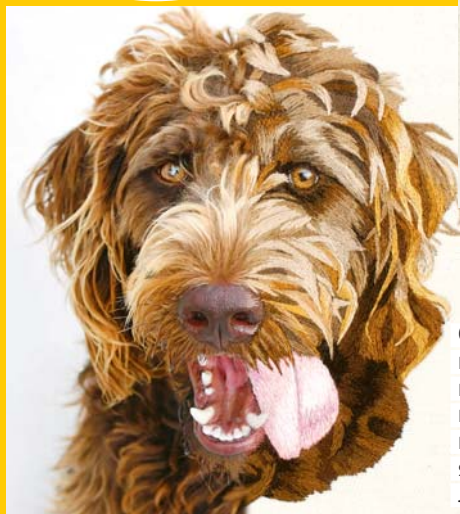
Спутанные прядки, выразительный взгляд и высунутый язык – это все лабрадудель!