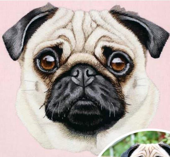
Взгрустнувший мопсик с приподнятыми бровками

хотя она никогда и не думала ни о чем подобном.