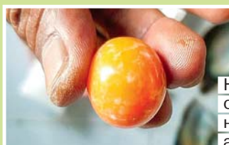
Находка очень похожа на крупную аскорбинку

рыбак. – Думаю, он и привел меня к жемчужине». За свою находку рыбак может выручить около 10 млн бат (ок. 25 млн руб.) и тем самым окончательно распрощаться с бедностью.