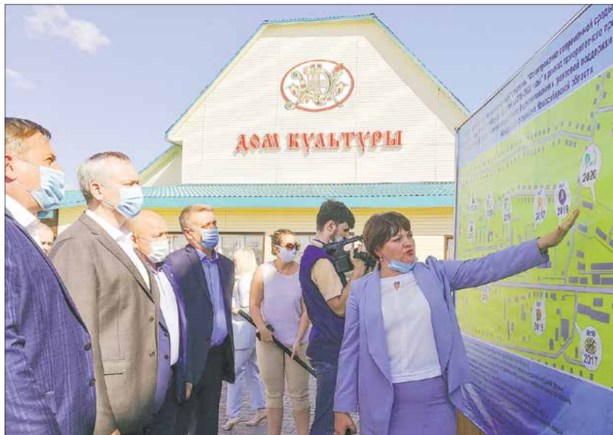
Глава сельсовета рассказывает о больших планах по его развитию