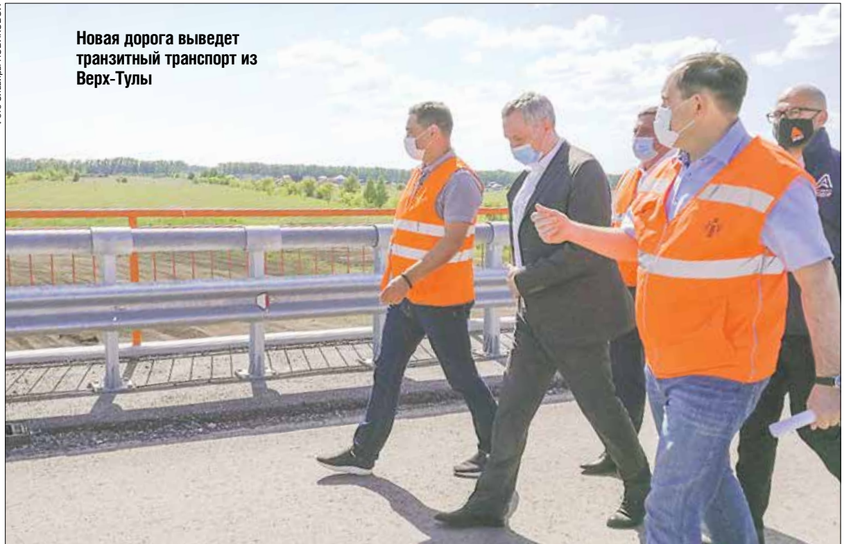
Новая дорога выведет транзитный транспорт из Верх-Тулы

Ехать по гладкому асфальту широкой автотрассы и правда одно удовольствие. Четыре полосы полотна разделены металлическим отбойником (в одну сторону две полосы, столько же — в другую), обустроены обочины. Мы постояли на вершине двухуровневой развязки. Вид отсюда открывается великолепный: современная отличная дорога, которая хороша была бы и для мегаполиса, с одной стороны уходит в бескрайние зеленые поля, с другой — пролегает в виде крепкого моста через речку, а потом, делая полукруг, теряется вдаль среди сибирских просторов. Кстати, эта развязка позволит машинам из Верх-Тулы безопасно выезжать на трассу. После того как транзитный транспорт покинет пределы населенного пункта, там существенно улучшится