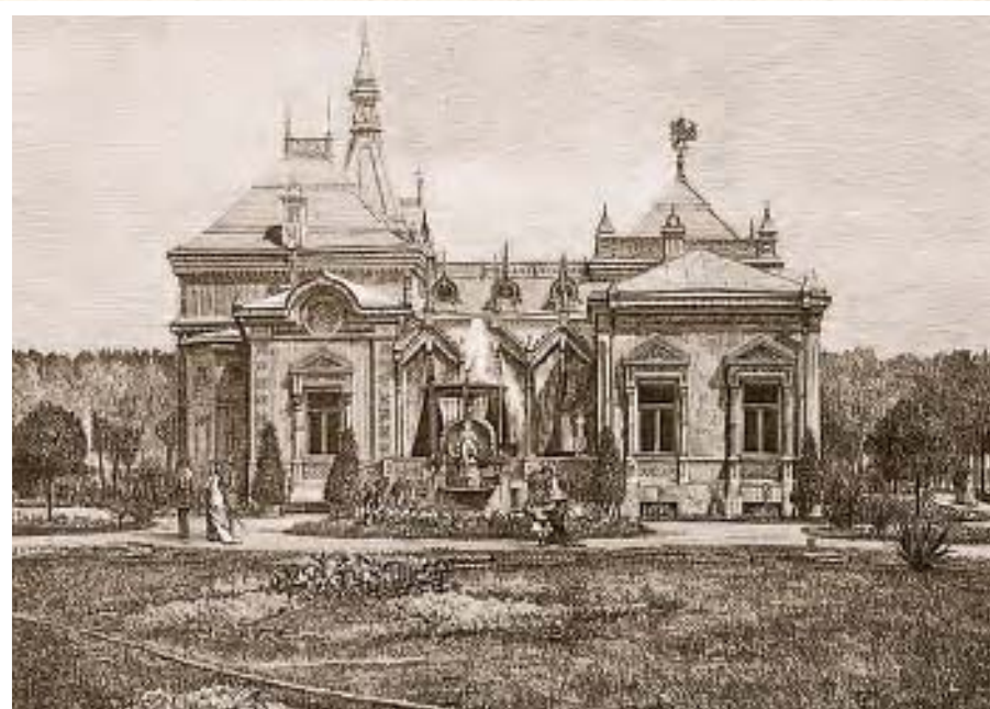
ЦАРСКИЙ ПАВИЛЬОН, 1882 г.

и в качестве подрядчика начал проводить работы в концертном зале Всероссийской художественно-промышленной выставки. Эта грандиозная экспозиция, призванная продемонстрировать достижения российского государства практически во всех сферах жизнедеятельности, начиная от садоводства и огородничества и заканчивая военным и морским делом, стала событием огромной важности в жизни Москвы и страны в целом. Все многообразие и богатство русского таланта и мастерства разместилось в восьми больших, раскрашенных яркими красками и золотом, павильонах, которые кругообразно соединялись между собой. Особый интерес представлял художественный раздел. В нем были