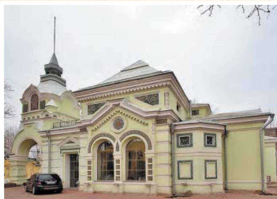
ЦАРСКИЙ ПАВИЛЬОН. Наше время

представлены работы прославленных российских живописцев: П. Брюллова, В. Верещагина, И. Айвазовского, А. Саврасова, А. Куинджи, В. Поленова, И. Шишкина и многих других.