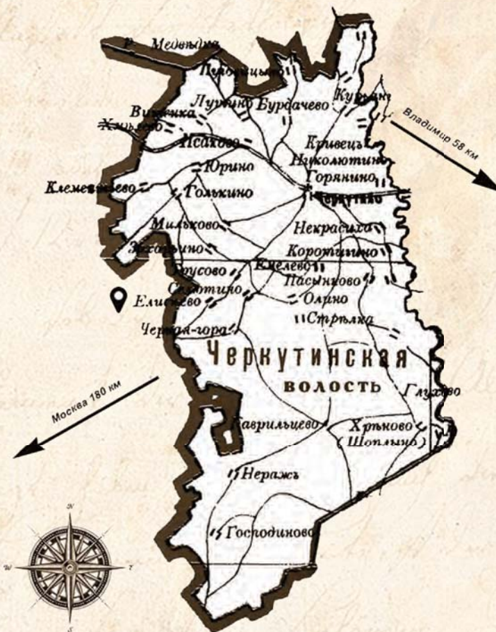
ЧЕРКУТИНСКАЯ ВОЛОСТЬ. Карта второй половины XIX в.