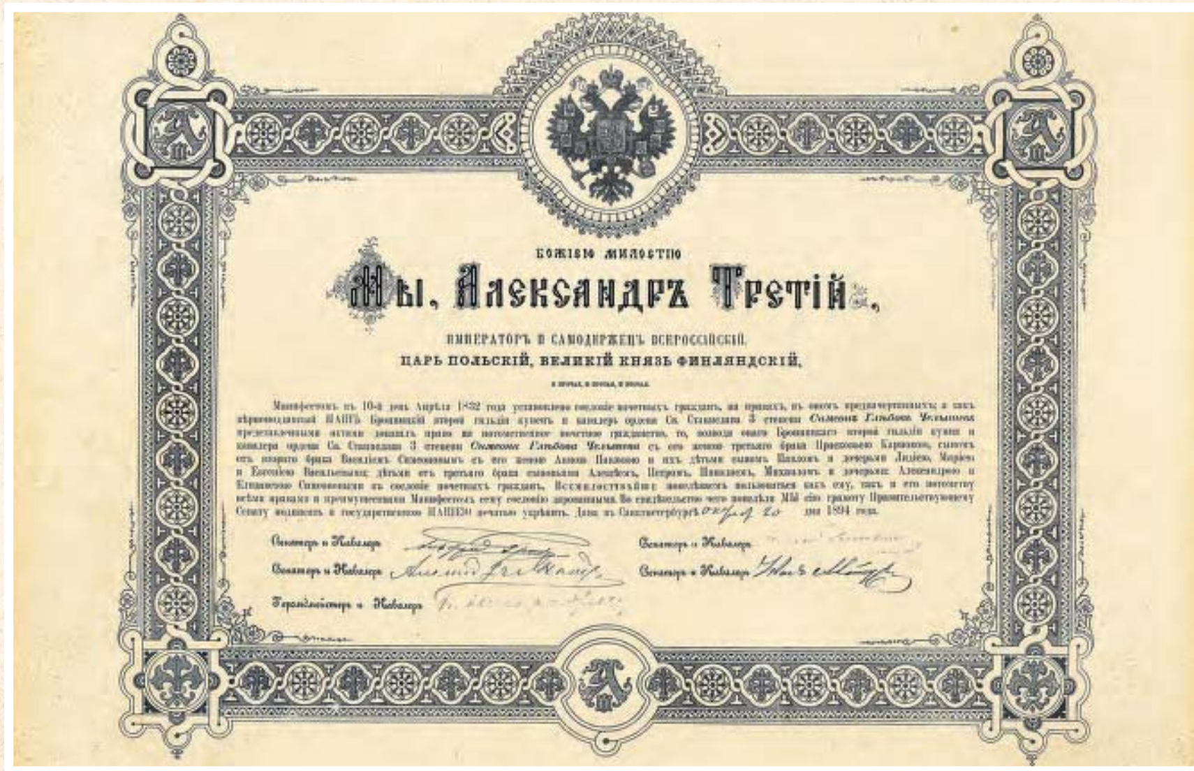
ГРАМОТА О ВОЗВЕДЕНИИ С. Г. ЧЕЛЫШЕВА В СОСЛОВІЕ ПОТОМСТВЕННЫХЪ ПОЧЕТНЫХЪ ГРАЖДАН, 1894 г.