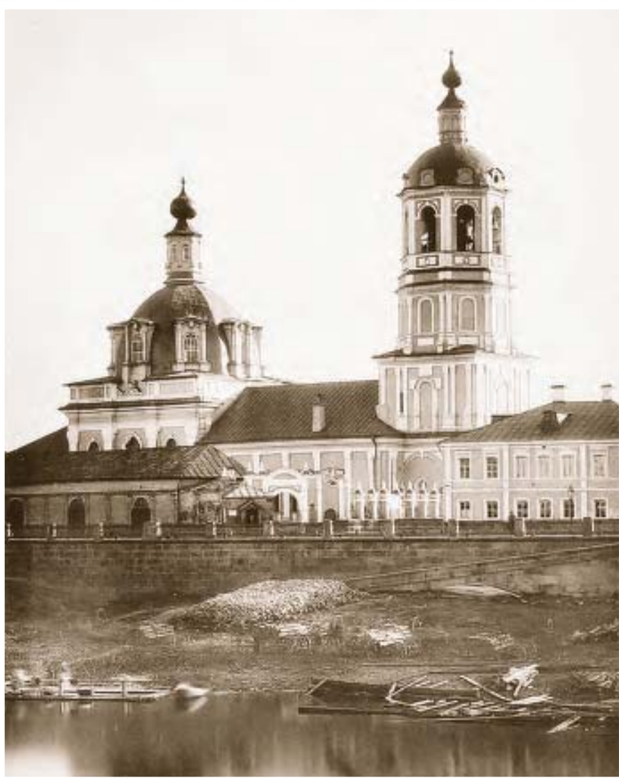
ХРАМ СВЯТИТЕЛЯ НИКОЛАЯ В ЗАЯИЦКОМ, 1882 г.