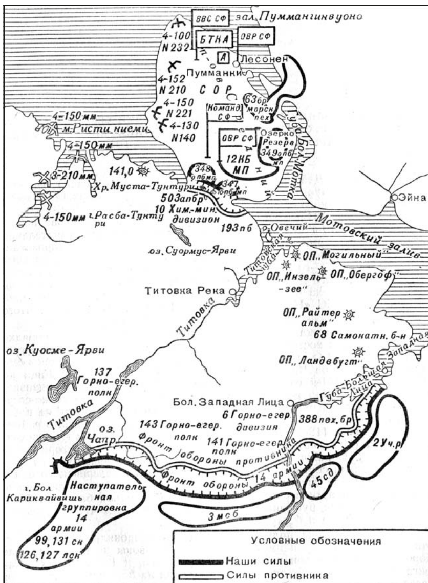
Рис. 4. Группировка войск противника на мурманском направлении накануне операции по освобождению Заполярья и расположение частей 14-й Армии и Северного оборонительного района