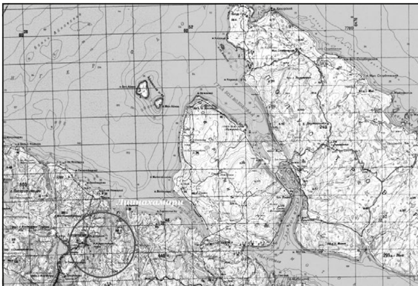
Рис. 3. Карта Лишнахамари и полуострова Средний

по важным военно-географическим территориям (Петсамо и Киркенес), которые в ходе Петсамо-Киркенесской наступательной операции осенью 1944 года освободили войска Карельского фронта и Северного флота. Известная также как «Десятый сталинский удар», эта операция была успешно проведена в период с 7 по 29 октября 1944 года во время Великой Отечественной войны 1941–45 гг.