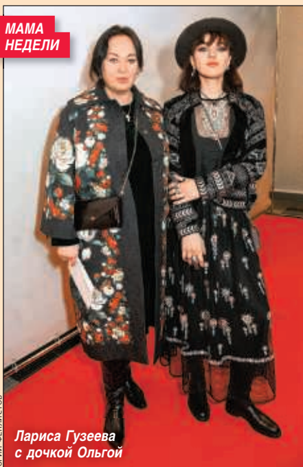
Лариса Гузеева с дочкой Ольгой