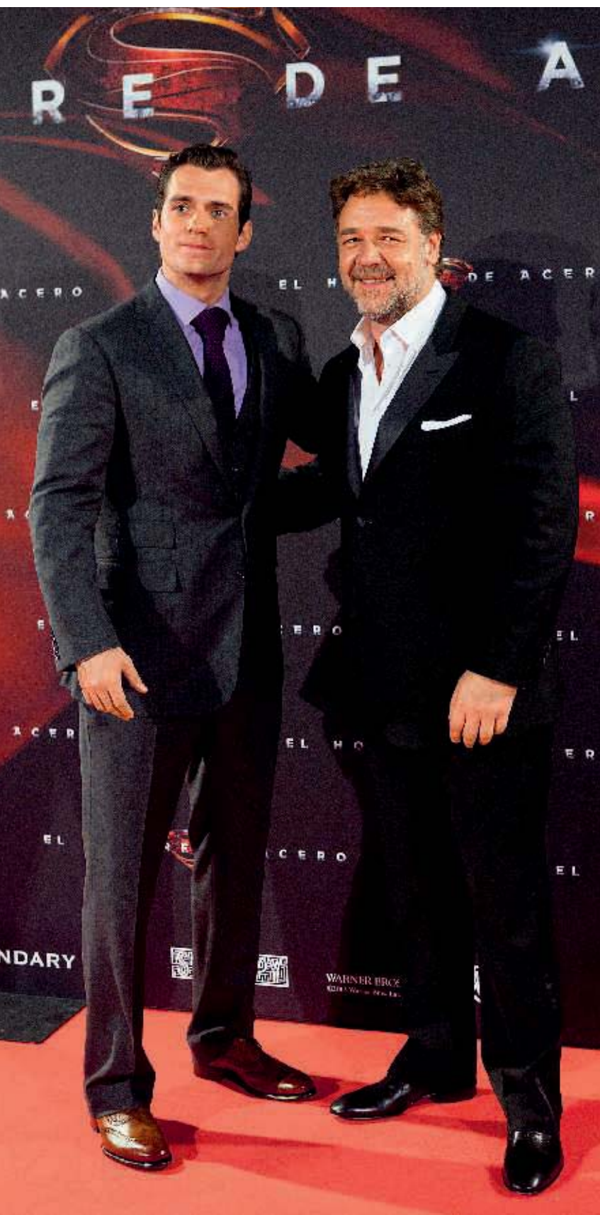
Генри и Рассел Кроу на премьере фильма «Человек из стали». (Мадрид, 2013 г.)

недруги Генри по интернату, благополучно поступившие в Кембридж и Йель, могли знать, как он пролетел.