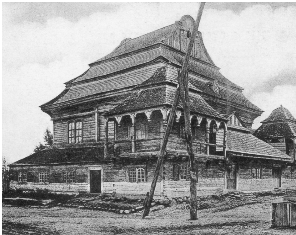
Синагога в Лунно Гродненской губ. С открытки нач. XX в.

Самой важной экономической привилегией, которую получили евреи, было включение их в «Грамоту на права и выгоды городам Российской империи» («Жалованную грамоту городам») Екатерины II (1785 г.), которая разрешила городам Российской империи иметь органы самоуправления (городские думы). Постановлением российского Сената — проводника имперских законов — от 1786 г. евреям особо было разрешено иметь право голоса в этих учреждениях и право состоять в них на службе. Евреи воспользовались этими правами, что встревожило их религиозных лидеров, опасавшихся, что «евреи сближаются с неевреями», и нееврейское городское население, которое смотрело на евреев как на серьезных экономических соперников. Тем не менее несмотря на некоторые специальные ограничения со стороны местных губернаторов, например сокращение доли евреев в городском представительстве до одной трети, евреи продолжали участвовать в городском самоуправлении.