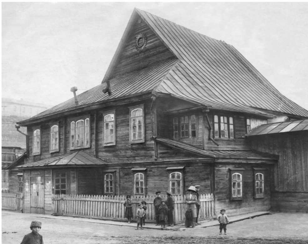
Деревянная синагога в г. Могилеве, Белоруссия (XVIII в.).