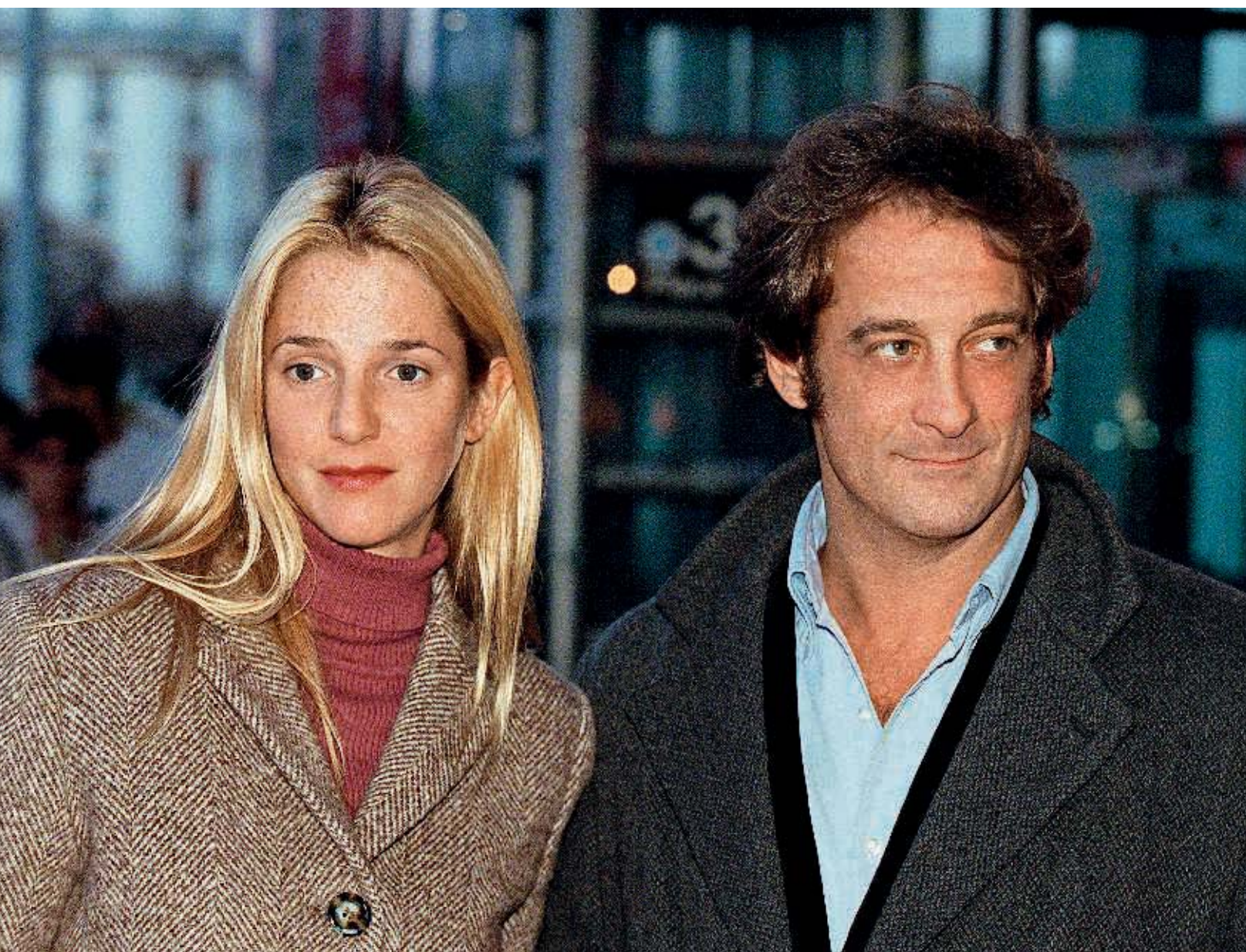
Бойфренд Кьяры Мastroяни, Венсан Линдон, по-прежнему любил свою жену — актрису Сандрин Киберлен. (На фото)