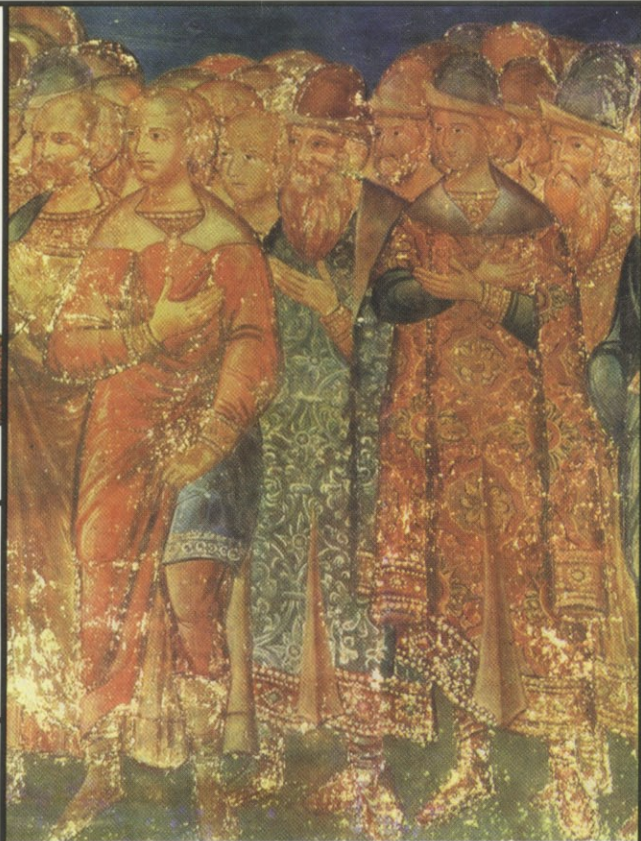
Деталь фрески кафедрального собора в Александрове, XVI век

ПОМИНОВАНИЕ КАЗНЕННЫХ В ОПРИЧНИНУ ПРАВОСЛАВНЫХ ХРИСТИАН В РУССКОЙ БОГОСЛУЖЕБНОЙ ПРАКТИКЕ ЭПОХИ ПОЗДНЕГО СРЕДНЕВЕКОВЬЯ