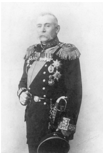
Адмирал Шмидт В. П.

Мой прадед, Владимир Петрович, был морским офицером. В 1860-е годы, будучи капитаном I-го ранга, он командовал императорской яхтой «Тигр», на которой часто плавал Государь 18 . И вот однажды произошел такой случай. Поднялся шторм в Балтийском море, и судно село на мель. Государь тоже вышел посмотреть. Поднялась суматоха: капитан Шмидт тут, Государь тут — и все распоряжаются. Капитану это не очень понравилось. Он считал, что ответственный он, а не кто другой. И он даже накричал на императора: «Ваше Императорское Величество, капитаном на корабле являюсь я! Прошу в каюту». Государь смутился и ушел к себе в каюту. Но потом мой бедный прадед не знал, куда себя деть, и утром, придя на рапорт, стоял смущенный. Но Император его даже как бы похвалил: «Напугал ты меня, Шмидт, вчера» [Фортунато (рпк. 2): 5—6] 19 .