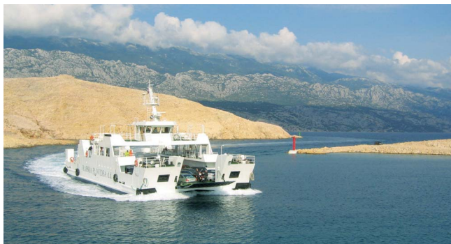
Паромы компании Jadrolinija регулярно курсируют между материком и островами

В Хорватии действуют следующие ограничения скорости: 50 км/ч в населенных пунктах, 90 км/ч на дорогах местного значения, 110 км/ч на скоростных шоссе и 130 км/ч на автобанах. Автомобили-кемперы массой св. 3,5 т могут разогнаться за городом до 80 км/ч. При обгоне сигнал левого поворота должен быть включен вплоть до завершения маневра. В период с октября по март, как правило, автодвижение в дневное время осуществляется с ближним светом. Допустимая норма алкоголя – 0,5 промилле, одна-