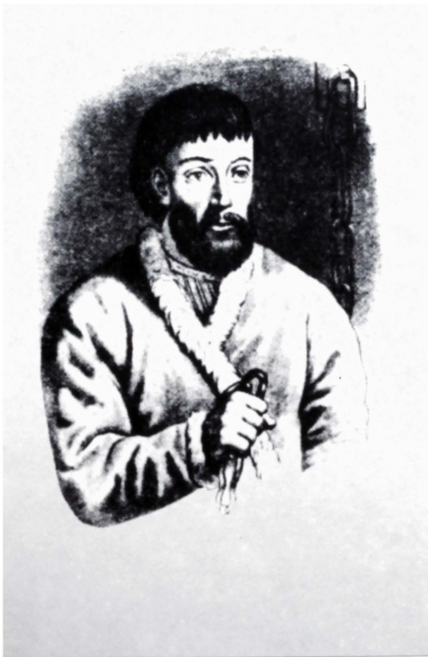
Е. И. Пугачев в тюремной камере в дни следствия над ним осенью 1774 года Гравюра впервые воспроизведена А. С. Пушкиным в книге «История Пугачевского бунта» (СПб., 1834).