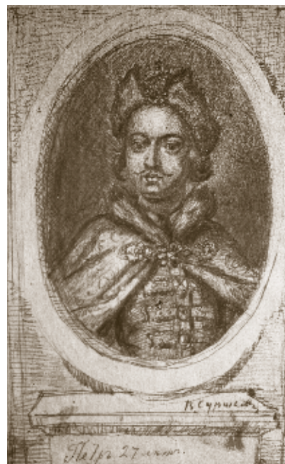
Петр I Великий, первый российский император.

Причем вначале местные сибирские власти, в том числе в Красноярске, внесли в подушные списки даже всех штатных рядовых казаков, вместе с их командной верхушкой. При этом они перусердствовали и детей верстанных казаков тоже внесли в подушные списки, и за них стали взимать ежегодно по 70 копеек подушных и 40 копеек оброчных денег. Это вызвало массовый протест, и в 1728 году детей исключили из списков. Однако в потенции верстанные казаки потомственно все же не оставались в своем сословии, так как при отставке или при физической непригодности детей к службе всех, в том числе из командной верхушки, переводили в тяглые сословия. Таким образом, казачество Сибири превращалось в чисто функциональную группу с постоянно меняющимся личным составом,