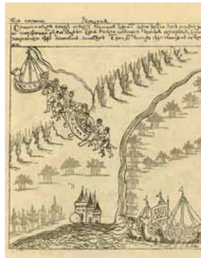
Волок, подобный которому экспедиция Дубенского преодолела водораздел рек Кемь и Кети.

Потребовалось сто лет вооруженной борьбы, перемежавшейся дипломатическими маневрами и компромиссами, прежде чем