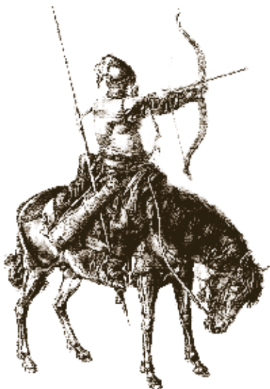
Стетной всадник, XVII век