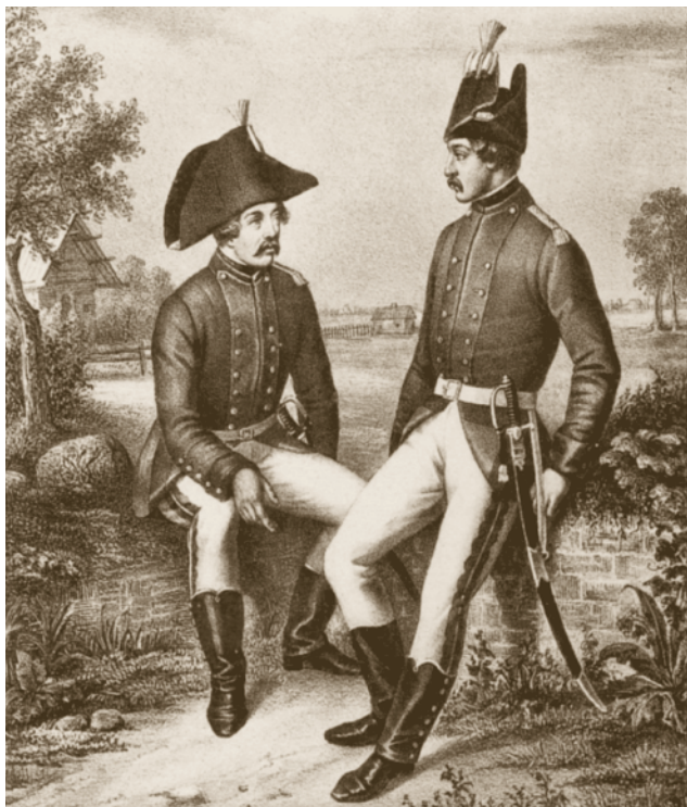
Рядовые штатных команд Иркутского и Кольванского наместничеств. Из книги «Описание одежды и вооружения Российских войск 862–1855 гг.»

пальцы свело и т.п.), а также цинга, кила, «слабость корпуса», падучая, венерическая болезнь.