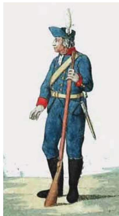
Гарнизонный солдат. Изображения мундиров Российско- Императорского войска, состоящих из 88 лиц иллюстрированных. СПб., 1793 г.

В прямом своем качестве (как военная сила) размещенные в Красноярске регулярные части практически не использовались. Многие из личного состава занимались только обеспечением своей части продовольствием, фуражом и починкой амуниции. В 1718–1762 годах видное место составляли обязанности по сбору подушных денег, борьбе с побегами и утайкой от обложения. Солдаты также участвовали в сборе различных окладных и неокладных сумм по уезду, контроле выборных посадских целовальников на таможах. Довольно широко военные чины, особенно офицеры, привлекались в административно-управленческих и хозяйственно-организаторских целях. В 1763–1783 годах, кроме замещения воевод, офицеры были экономическими казначеями у бывших монастырских крестьян края, а с 1780-х годов они встречаются среди надзирателей, или «посельщичьих смотрителей», в селениях крепостных, сосланных в зачет рекрутов.