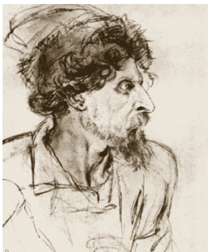
Тип сибирского казака XVII–XIX вв. Эскиз для одной из центральных фигур картины В.И. Сурикова «Утро стрелецкой казни». Изображен дядя со стороны матери из семьи потомственных казаков Торгашиных

В целом отрыв казачьей верхушки от рядовой массы служилых людей в течение XVIII века принимал все явственней классово-антагонистический характер, хотя старые сословно-корпоративные рамки с 1787 года стали сохраняться лучше. Казачество все больше превращалось в замкнутую служилую корпорацию. По-прежнему живя в городе и уезде, красноярские казаки составляли одну общую организацию общинного типа. Служилые регулярно собирались на свои казачьи круги, ежегодно распределяли между собой разные службы: ясачный сбор, таможню, годовую службу, сопровождение казенных грузов, караулы при учреждениях, на винокурнях, заводах, мельницах и так далее. Причиненный казне материальный ущерб мог возмещаться сообща. Казачий круг распоряжался общим и выморочным имуществом, свободными сельскохозяйственными угодьями, отведенными казакам. Выбираемый казачий голова утверждался воеводой и подчинялся ему. Казачьи дети, пройдя специальную подготовку