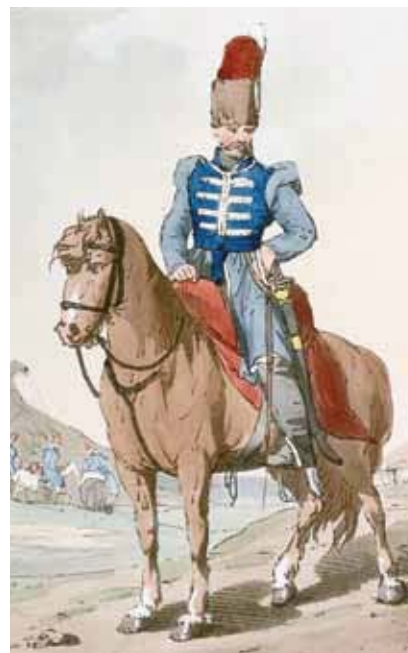
Казачий офицер. Рисунок Д.А. Аткинсона

О тяготах казачьей службы свидетельствуют и мотивы отставки. Из-за различных болезней служебно непригодными оказалось больше казаков, нежели из-за старости (соответственно 28 и 24), причем у 14 «старых и дряхлых» возрастные недуги сопровождалась благоприобретенными болезнями или увечьями. Довольно высоким был удельный вес покалеченных (10 из 52), в основном от «конского бою». Среди болезней чаще всего встречаются глазные (10 человек «глазами тупы и слепы»); внутренние («нутряная болезнь», чахотка, душье); недуги простудные (ломота в ногах и руках, шум в голове,