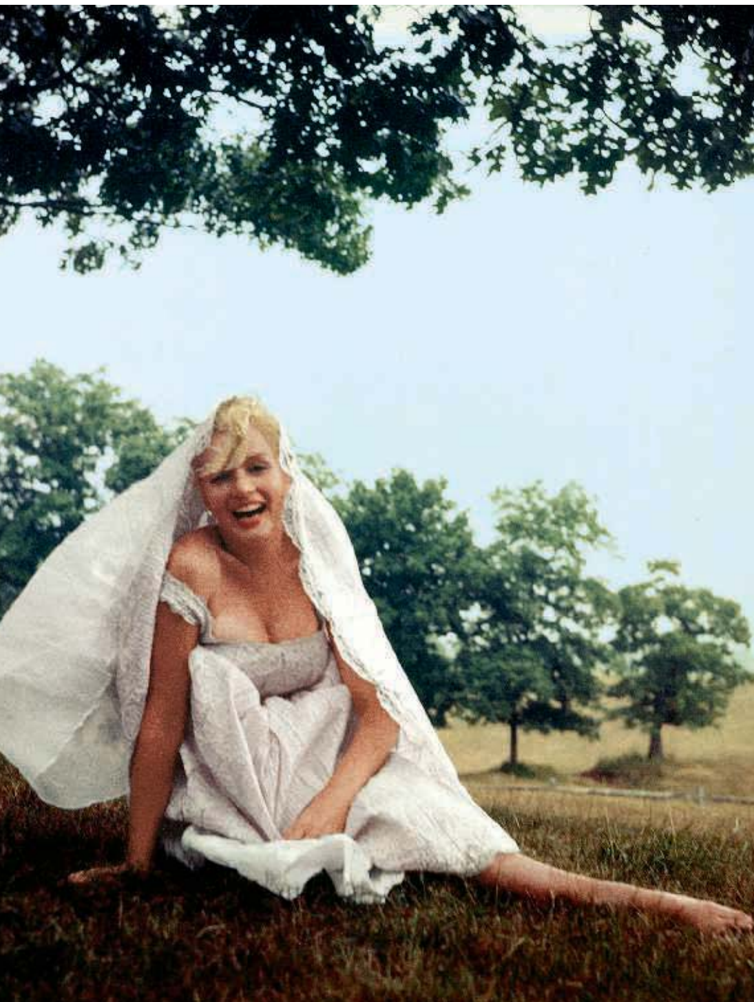
Фотопортрет, запечатлевший хохочущую Монро, висел в спальне Мишель