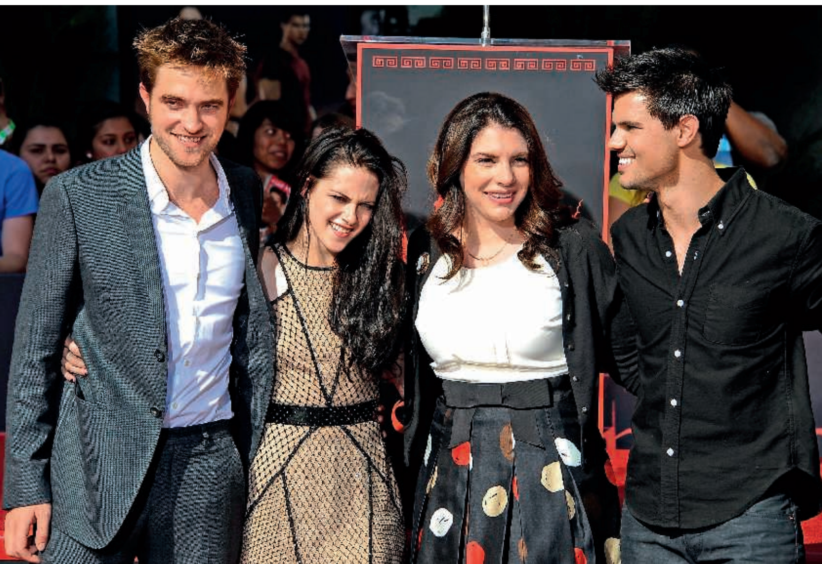
Кристен отчетливо поняла: среди всех коллег-актеров по фильму она может доверять только одному человеку — Роберту. Паттисон, Стюарт, Стефани Майер и Тейлор Лотнер. Голливуд, 2011 г.