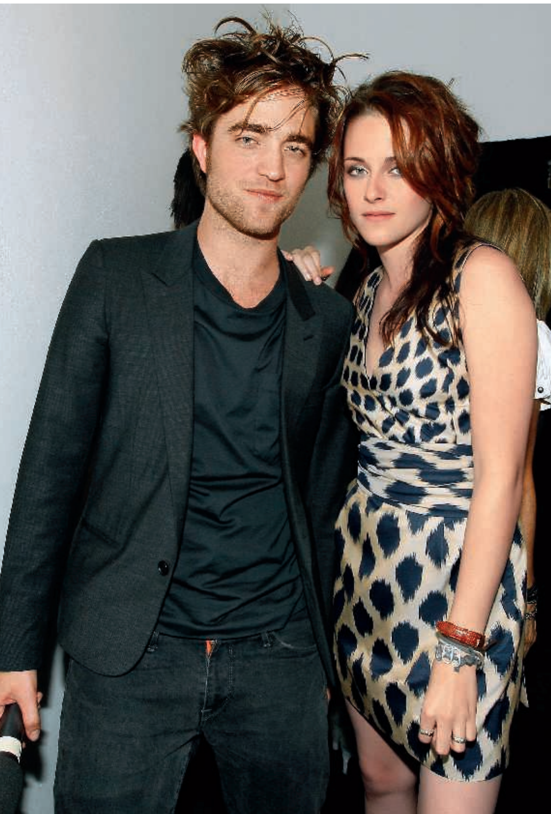
Их романтические отношения были на руку продюсерам. Роберт и Кристен. Калифорния, 2008 г.