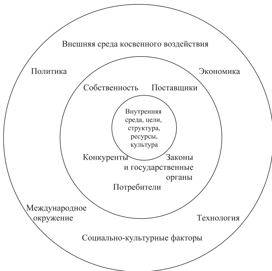
Рис. 1.1. Предпринимательская среда

Важную роль в обеспечении экономической свободы и, следовательно, развития предпринимательства имеет реализация на практике положений ст. 35 Конституции РФ, в которой установлены следующие фундаментальные положения.