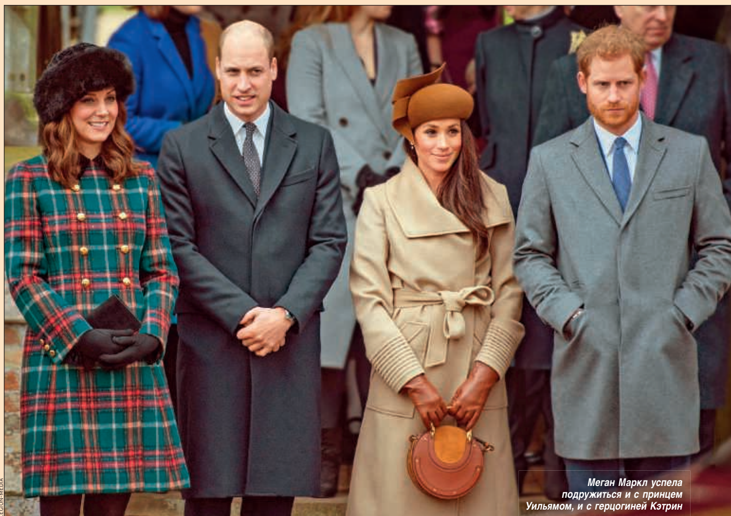
Меган Маркл успела подружиться и с принцем Уильямом, и с герцогиней Кэтрин

Впрочем, даже если Гарри пойдет на такой шаг, никто из тех, кто помнит свадьбу его старшего брата, особо не удивится. Ведь Уильям ухитрился пригласить на свое бракосочетание с Кэтрин даже не двух, а пять девушек,