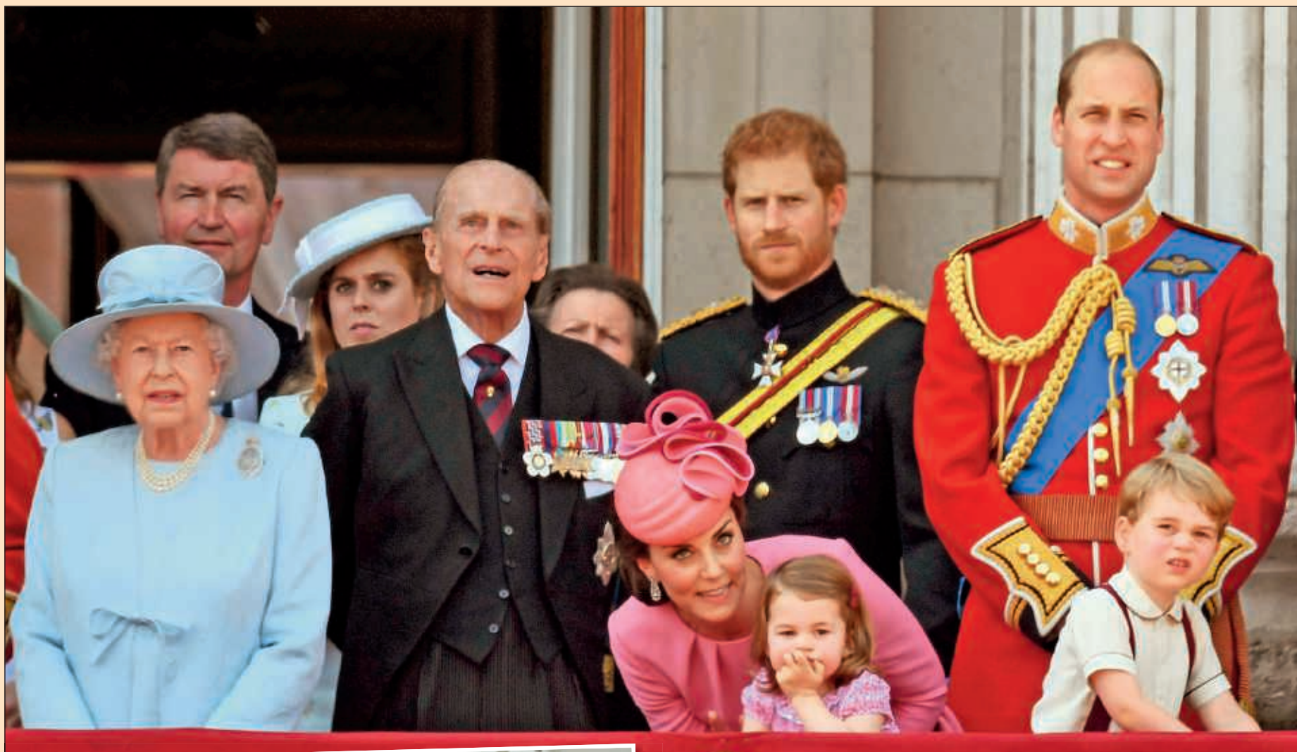
Выбор Гарри одобрили и его отец принц Чарльз, и мачеха Камилла Паркер-Боулз