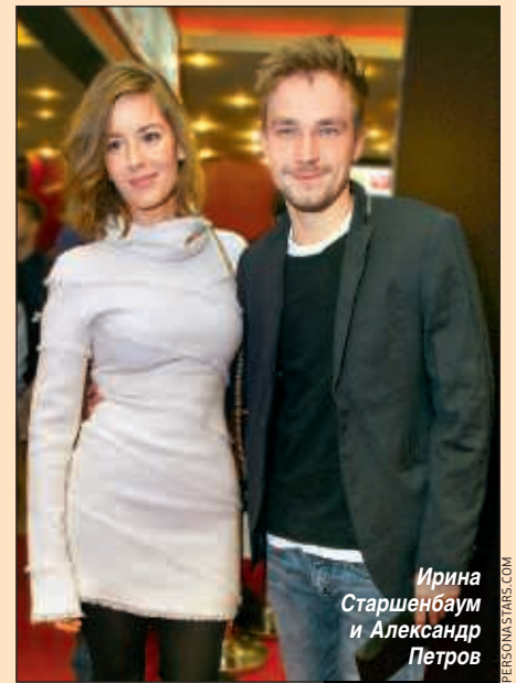
Ирина Старшенбаум и Александр Петров