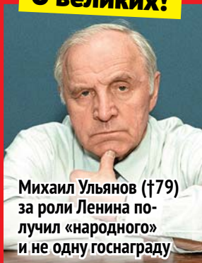
Михаил Ульянов (†79) за роли Ленина получил «народного» и не одну госнаграду