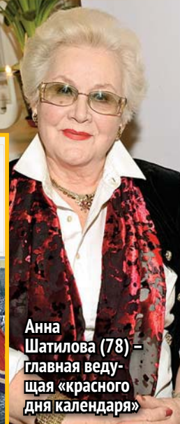
Анна Шатилова (78) – главная ведущая «красного дня календаря»

В СССР каждый мог ответить на вопрос «Почему Великая социалистическая революция – Октябрьская, а ее день отмечается 7 ноября?» Ведь это изучали в школе. Большевики свергли Временное правительство, заседавшее в Зимнем дворце, 25 октября 1917 года по старому стилю. А с января-1918 Россия перешла на новый стиль времени. И по нему знаковая дата пришлась как раз на 7 ноября. Тот самый «красный день календаря» – один из главнейших праздников Союза! Отмечать его должны были все. Явка на демонстрации была обязательной. А кульминацией становился, конечно же, парад на Красной площади. Трансляцию с него чаще всего вела диктор советского ТВ Анна Шатилова.