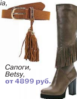
Сапоги, Betsy, от 4899 руб.