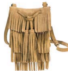
Сумка, bonprix, от 2390 руб.