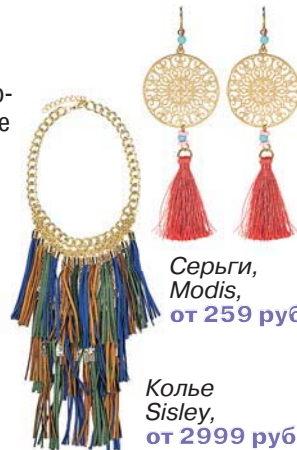
Серьги, Modis, от 259 руб.

Украшения, похожие на узелковое письмо инков, или на кисточки китайских фонариков, или на индейские наряды... В самых разных концах света можно найти идеи, как и где использовать бахрому!