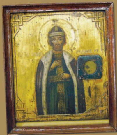
Икона святого князя Романа Угличского с частицей мощей. Начало XX века. Воскресенский собор

Дата основания города и по сей день остаётся загадкой, которая вызывает споры и появление новых гипотез. По общепринятой версии, в 1283 году город основал угличский князь Роман Владимирович. Таким образом, основание города можно считать уникальным явлением в русской истории. Романов является единственным городом в Северо-Восточной Руси, который начал своё существование в период страшного разора, известного как монголо-татарское нашествие. Ряд краеведов придерживается иной точки зрения: они полагают, что город был основан ярославским князем Романом Васильевичем, и произошло это в 1345 году. Но в это время юному князю, получившему надел от своего отца, было всего 10–11 лет. Местные краеведы утверждают, что город был основан угличским князем Романом Владимировичем, а ярославский князь Роман Васильевич возродил его из пепла.