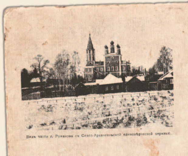
Видь части г. Романова съ Спасо-Архангельской единовѣрческой церковью.

В XIX веке в волжском городе по служебной надобности находился И. С. Аксаков. Он отмечал наличие большого количества старообрядцев в крае. С 1855 по 1872 год Спасо-Архангельская церковь имела статус единоверческой.