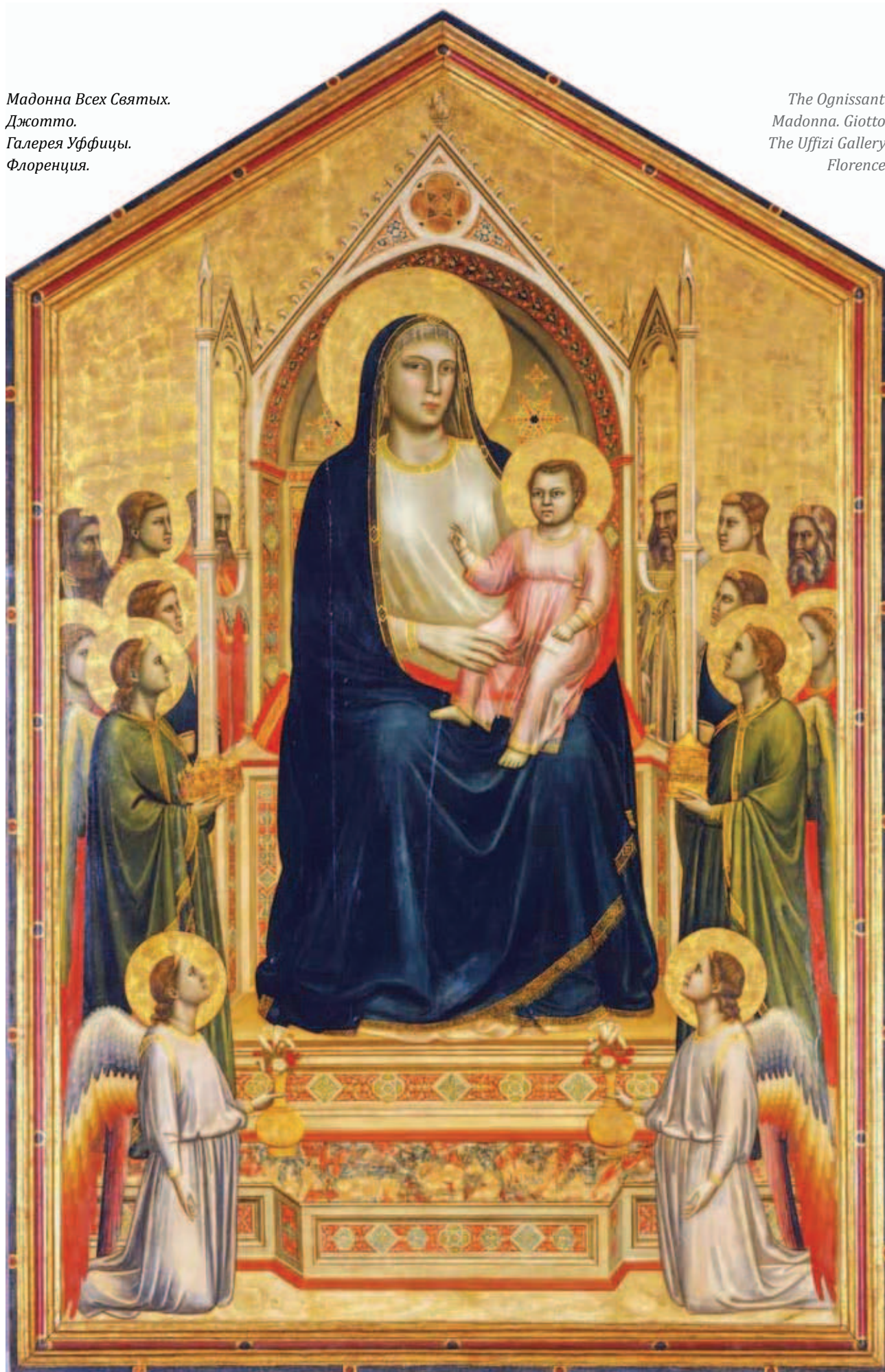
The Ognissanti Madonna. Giotto. The Uffizi Gallery. Florence.