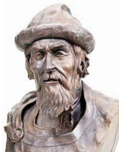
Ярослав Мудрый. Yaroslav the Wise.

предостаточно. Если Флоренция считается самым итальянским из итальянских городов, то Ярославль с его многочисленными средневековыми храмами и купеческими особняками XIX века имеет полное право считаться одним из самых русских городов. Флоренция – столица Тосканы, колыбель итальянского Ренессанса, «новые Афины». А Ярославль – столица «Золотого кольца России», популярного и среди соотечественников, и особенно среди иностранцев, туристического маршрута. Именно с ярославских земель более тысячи лет назад началось освоение Северо-Восточной Руси славянами.