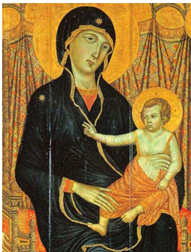
Мадонна Ручеллаи, деталь. Галерея Уффици. Флоренция. Madonna Rucellai, the element. The Uffizi Gallery. Florence.