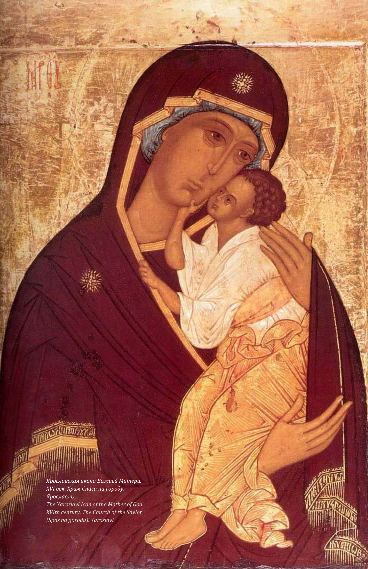
Ярославская икона Божией Матери. XVI век. Храм Спаса на Городу. Ярославль. The Yaroslavl Icon of the Mother of God. XVIth century. The Church of the Savior (Spas na gorodu). Yaroslavl.