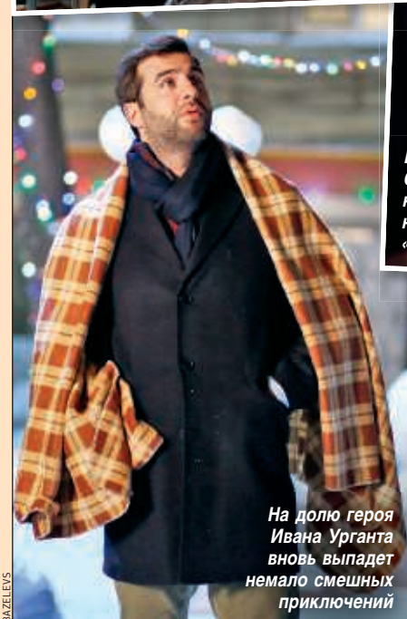
На долю героя Ивана Урганта вновь выпадет немало смешных приключений