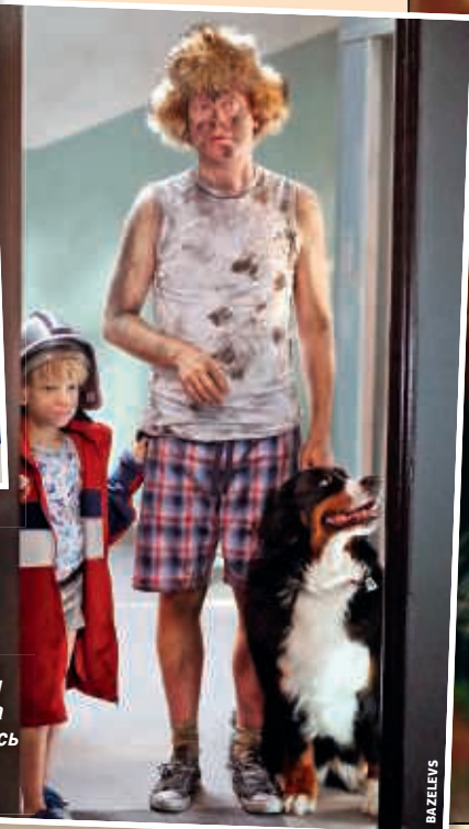
Дмитрий Нагиев и Елена Яковлева