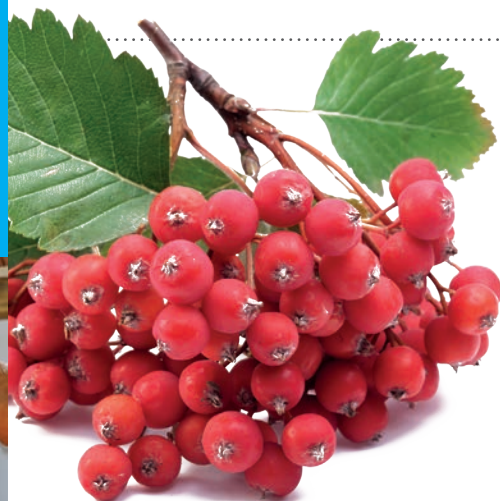
40 СОРТА РЯБИНЫ