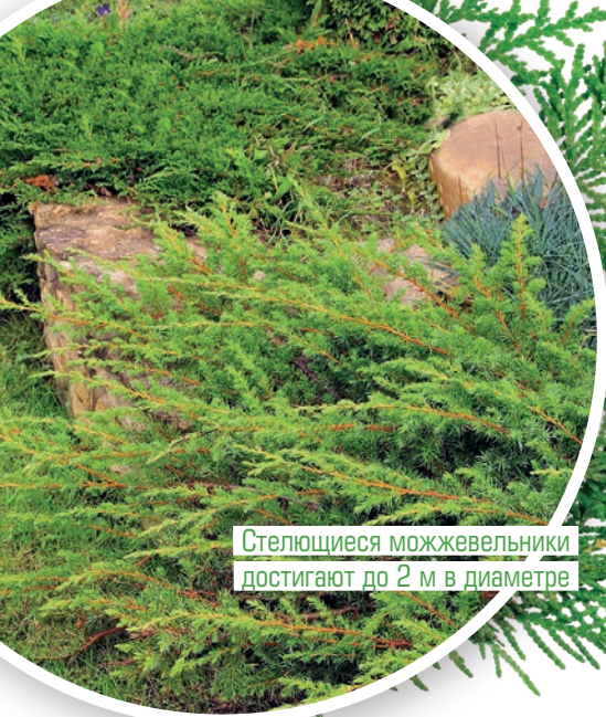
Стелющиеся можжевельники достигают до 2 м в диаметре

в композициях, созданных в том числе и для верхнего обзора (то есть с верхних этажей дома, с балкона). Для этой цели хорошо взять можжевельники средней высоты с распростертыми кронами либо сосну горную f. pumilio и барбарисы Тунберга 'Golden Rocket', 'Aurea' и перемежать их между собой.