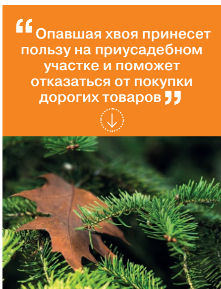
34 ТОЛЬКО ПОЛЬЗА ОТ ОПАВШЕЙ ХВОИ

“Опавшая хвоя принесет пользу на приусадебном участке и поможет отказаться от покупки дорогих товаров”