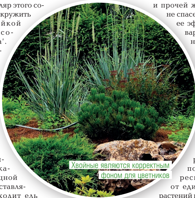
Хвойные являются корректным фоном для цветников

от парной посадки. Одиночный экземпляр этого сорта можно окружить парой-тройкой шариков сорта 'Danica'. Лишь в регулярном саду с множеством топиарных форм роль данных хвойных с акцентной меняется на заполняющую. В качестве мощной цветной составляющей подходит ель колючая 'Glauca Globosa', 'Hoopsii', туя западная 'Rheingold', 'Yellow Ribbon'. Учтите, что все они — сильные магниты для взгляда, поэтому расставляйте вдумчиво, словно шахматные фигуры на доске.