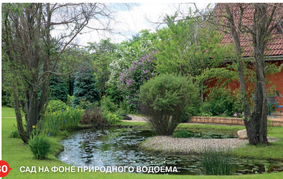
30 САД НА ФОНЕ ПРИРОДНОГО ВОДОЕМА