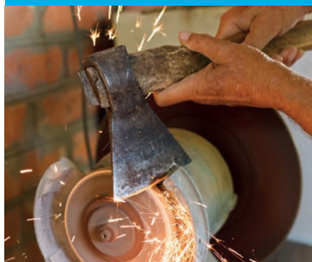
26 НЕЗАМЕНИМЫЙ ТОПОР

“Топор появился несколько тысячелетий назад, но до сих пор не нашел себе замены и не потерял своей актуальности”