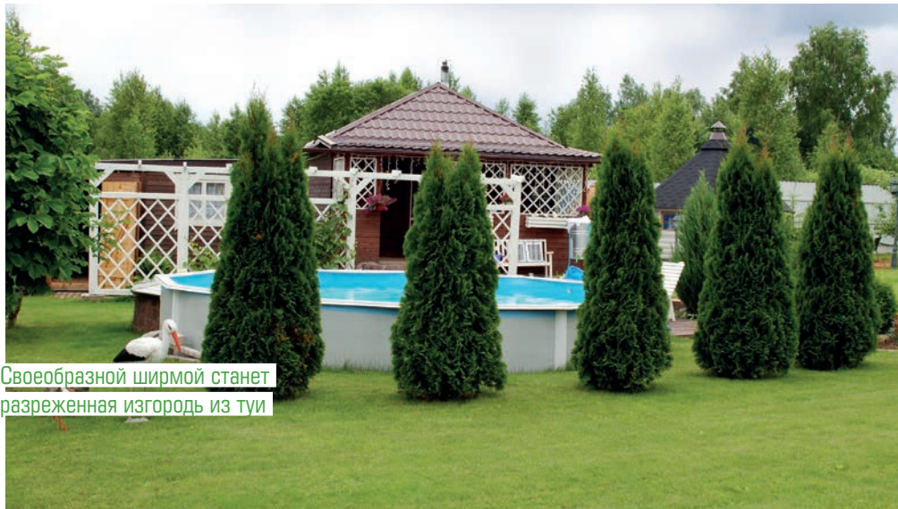
Своеобразной ширмой станет разреженная изгородь из туи

Четко очерченные кроны некоторых хвойных растений дарят саду завершенность. Этого непростого достичь с другими представителями флоры. Например, если получилась слишком пышная и бесформенная бордюрная композиция, то выходом станет замена нескольких растений первого и второго планов на шарики туи западной 'Mr. Bowling Ball', 'Danica', пихты