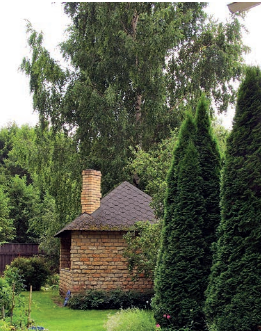
Очерченные кроны сортов туи — отличные акценты

Своеобразной ширмой или легким вариантом живой зеленой изгороди станет разреженная посадка в ряд. Растения используются те же, но элегантнее смотрится самая наша привычная туя западная 'Smaragd'. Она дает ровную и практически одинаковую у всех саженцев форму, которую в случае