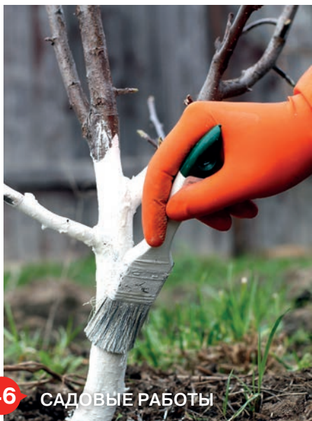
46 САДОВЫЕ РАБОТЫ