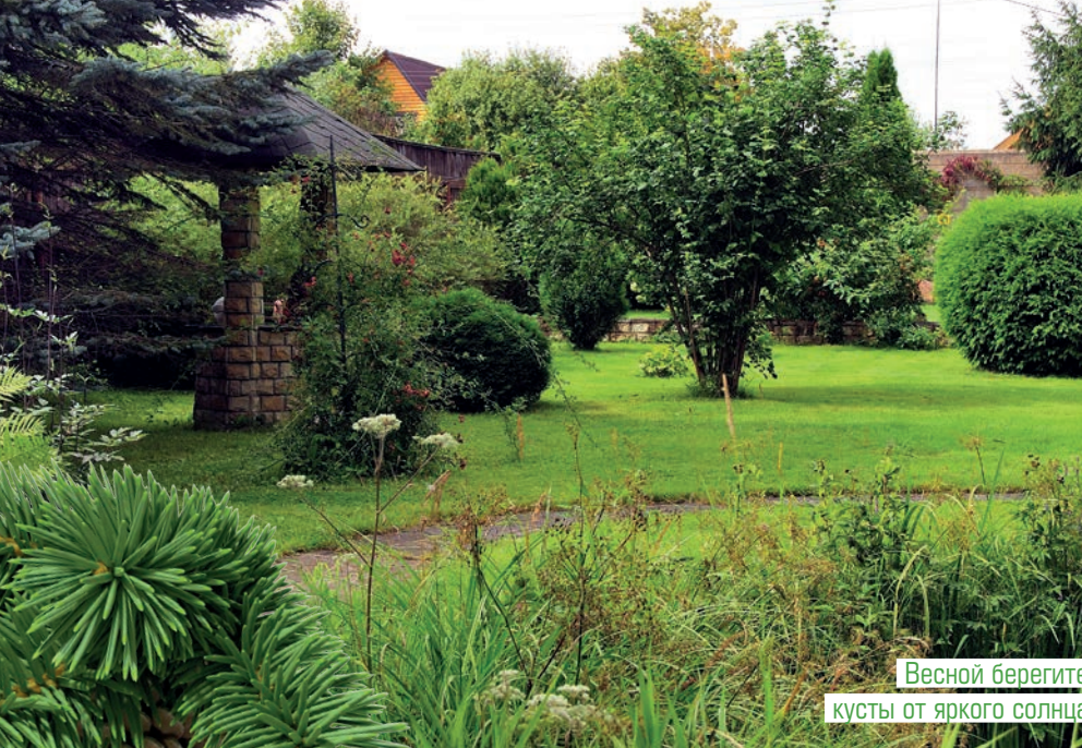
Весной берегите кусты от яркого солнца