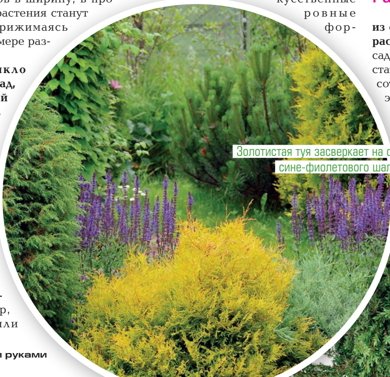
Золотистая туя засверкает на фоне сине-фиолетового шалфея

окрашенная в золото туя вряд ли станут естественным продолжением леса средней полосы России. В этом случае больше подойдут растения с зеленой хвоей, в крайнем случае — с легким золотистым налетом на кончиках; практически совсем исключаются бросающиеся в глаза искусственные ровные фор-