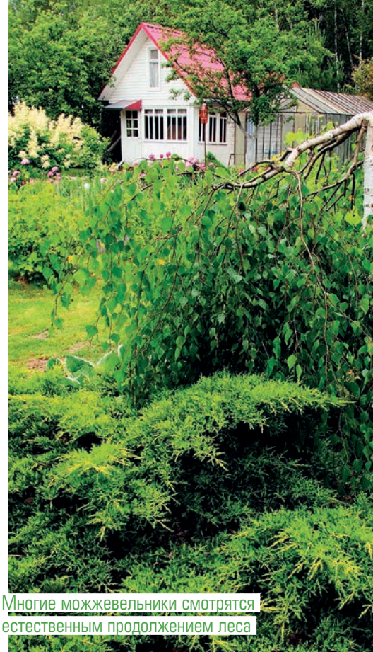
Многие можжевельники смотрятся естественным продолжением леса

Хвойные растения дарят гармоничный фон зрелищным многолетникам и кустарникам. Прежде всего, это самые любимые садоводами растения: розы и гортензии, флоксы, ирисы, хризантемы, дельфиниумы, лилии и лилейники, клематисы. Хвоя подчеркнет скромную красоту и обычных полевых ромашек, колокольчиков, анафалиса, астильбы. В свою очередь, сопровождающие растения обогащают