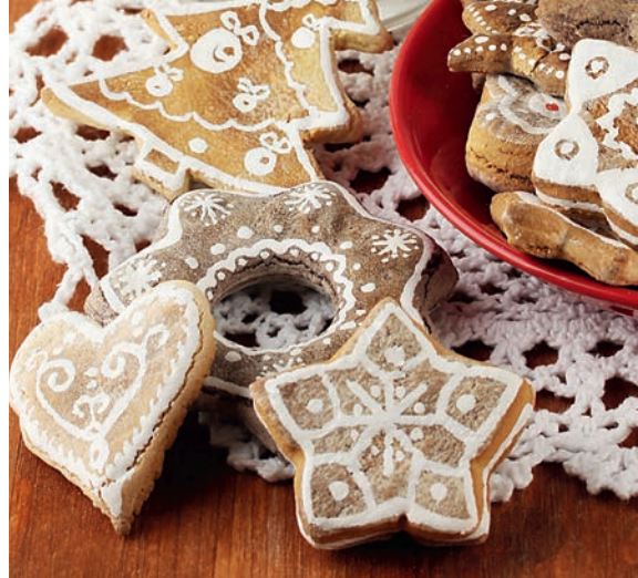
46 Рецепты необычных и вкусных лакомств

48 Что включает в себя понятие «нормальное развитие»?