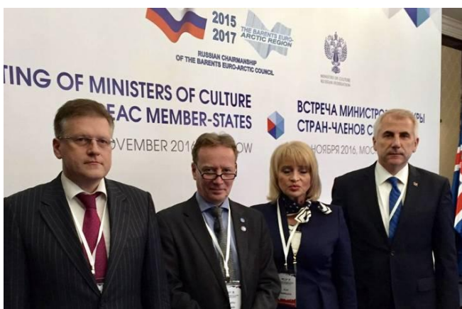
«Консул» №3 (49) 2017

Большое значение имела прошлогодняя встреча в Санкт-Петербурге, посвященная