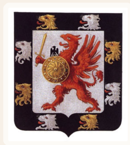
Герб рода Романовых