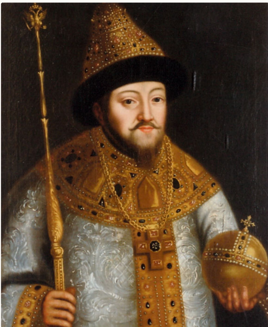
Неизвестный художник. Портрет Михаила Федоровича

Личность основателя династии Романовых, царя Михаила Федоровича, значительно уступает по яркости как отцу, патриарху Филарету, так и сыну, царю Алексею Михайловичу. Государь-юноша, взошедший на престол на исходе кровавой Смуты, Михаил Федорович был и остается загадкой для историков. Он не отличался выдающимися достоинствами, которые могли бы привлечь к нему выбор в 1613 г. Не ясно и то, как тихий, богомольный царь сумел успокоить бушевавшую вражду и вернуть страну к мирной жизни. Царь Михаил Федорович правил чуть более 30 лет