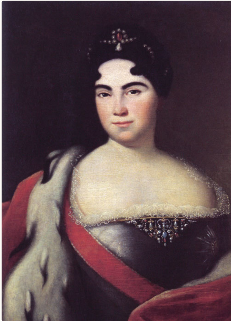
Императрица Екатерина I