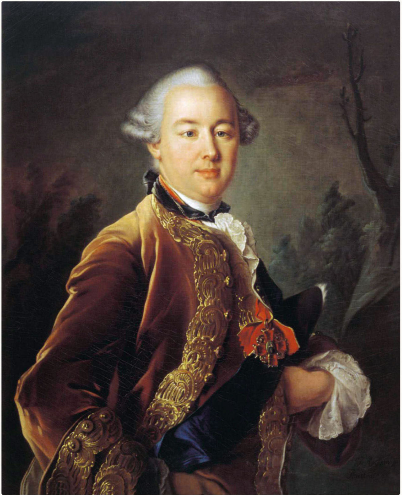
Б. П. Шереметев