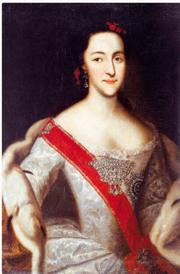
Портрет юной Екатерины

Супружеская жизнь молодых людей оказалась неполноценной. Петр не скрывал, что не любил свою жену, хотя и был к ней привязан. А Екатерина довольно быстро нашла утешение в любовных связях с другими мужчинами.