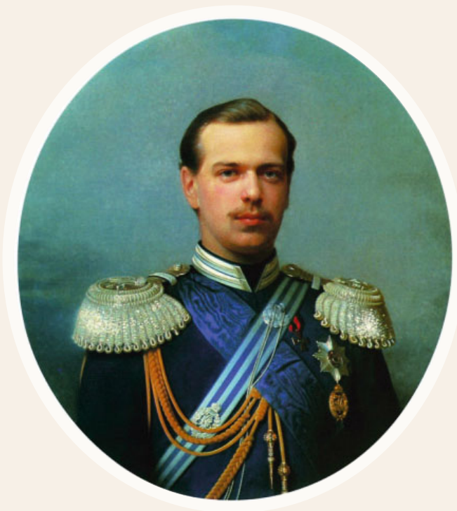
Зарянко С. К. Портрет цесаревича Александра Александровича