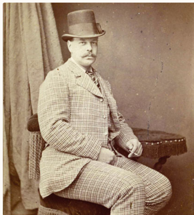
Наследник Александр Александрович

к этой женщине. Даже после отставки не прерывалась связь старой няни с ее воспитанниками. За няней присматривали, обеспечивая ей покойную старость. Жила она в казенной квартире в Зимнем дворце. Когда няня умерла, Александр III счел своим долгом присутствовать на ее похоронах. Обычно этой чести удостоивались только члены семьи и высшие государственные деятели.