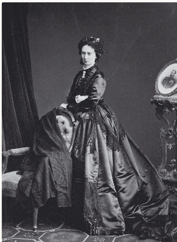
Мария Александровна, Императрица России (1824—1880), мать Александра III