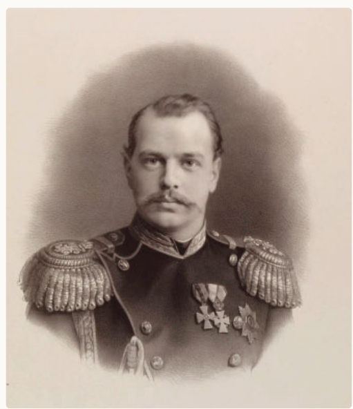
Александр II. Отпечаток с фотографии Йозефа Альберта (1825—1886)

В раннем возрасте он был крайне застенчив, что порождало в нем некоторую резкость и угловатость. В семье Сашу звали бульдожкой.