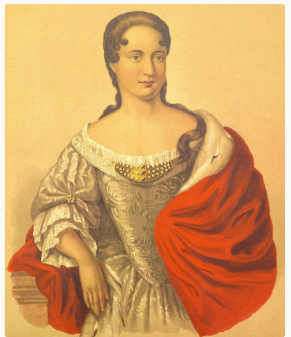
Царица Прасковья Федоровна