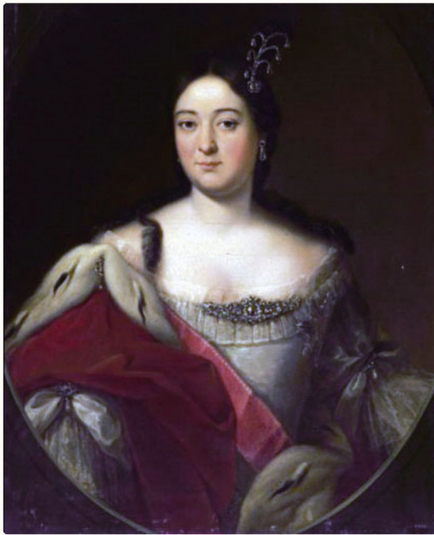
Екатерина Иоанновна Мекленбург-Шверинская