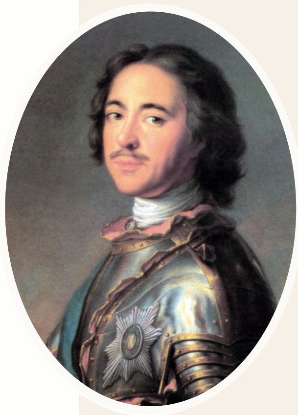
Портрет Петра I

Герцог был человеком грубым и жестоким. Он не мог снискать расположения ни подданных, ни соб-