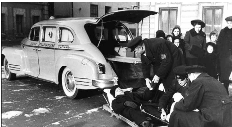
Автомобиль скорой помощи ЗИС-110А