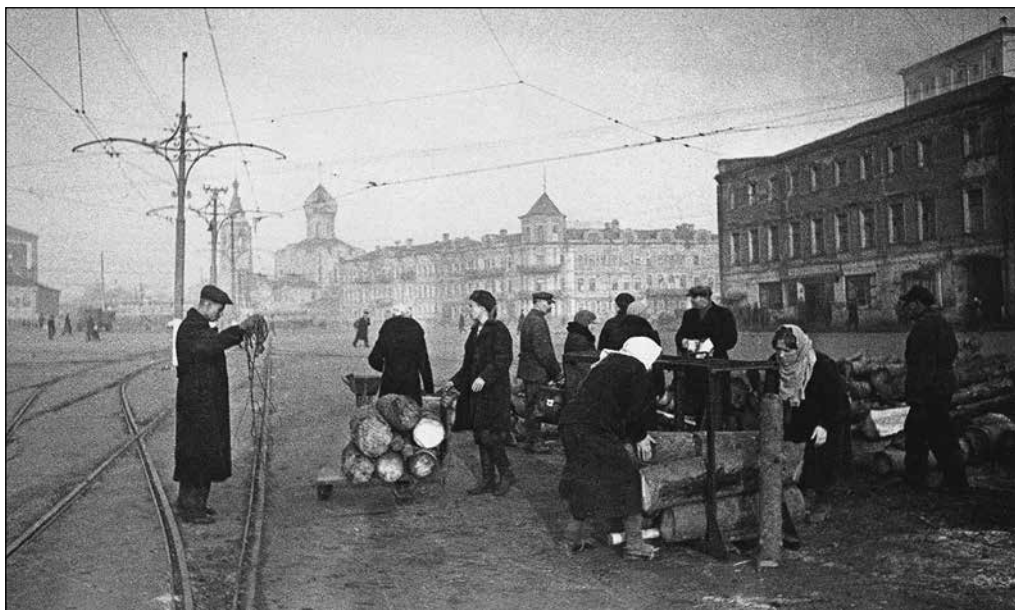
Москвичи запасаются дровами. Осень 1941 года