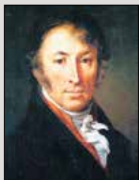
Основан Н.М. Карамзиным в 1791 году. Возобновлен в 1991 году

ИСТОРИЯ ГОСУДАРСТВА РОССИЙСКОГО ЕЖЕМЕСЯЧНОЕ ИЛЛЮСТРИРОВАННОЕ ИЗДАНИЕ