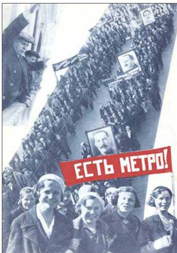
Эль Лисицкий. Есть метро! Страница из журнала «СССР на стройке». 1935 год. № 8

Московский метрополитен: история замысла и его осуществления