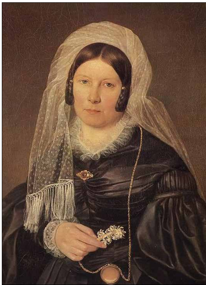
Неизвестный художник. Екатерина Андреевна Карамзина. 1830-е годы