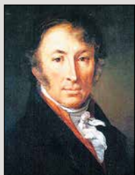
Основан Н.М. Карамзиным в 1791 году. Возобновлен в 1991 году

Литературно-художественный, историко-краеведческий журнал