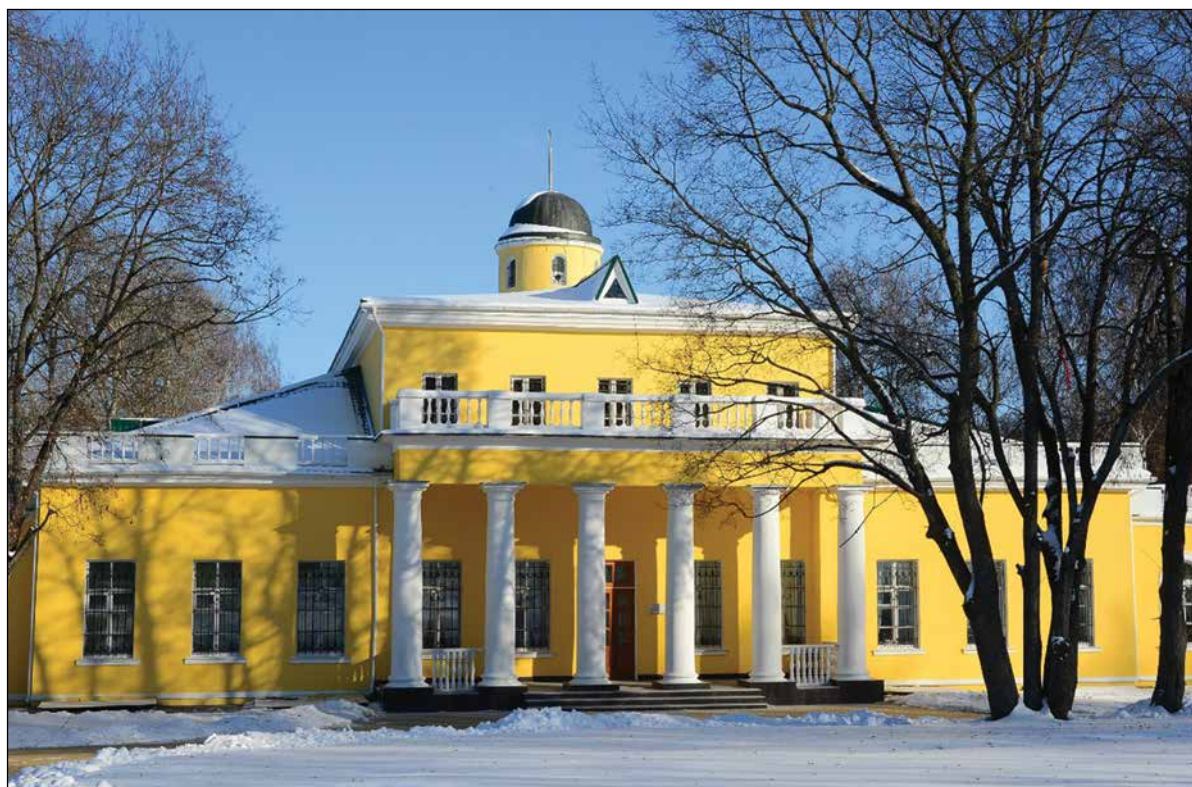
Дом-музей Ф.И. Тютчева в Овстуге.

В одном из залов Государственного мемориального историко-литературного музея-заповедника Ф.И. Тютчева «Овстуг» можно видеть портрет Н.М. Карамзина (копия полотна, созданного в 1805 году итальянским художником Дж. Б. Дамоном-Ортолани) и несколько томов «Истории государства Российского». И это не случайно: тютчевское творчество нельзя представить в отрыве от родной истории. Другьями и единомышленниками Федора Ивано-