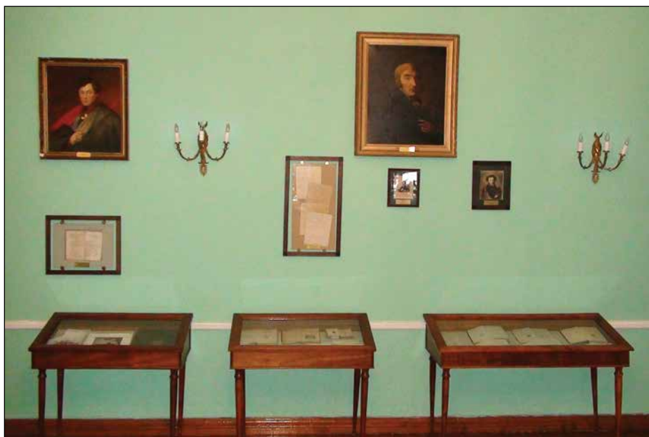
Фрагмент экспозиции дома-музея Ф.И. Тютчева.