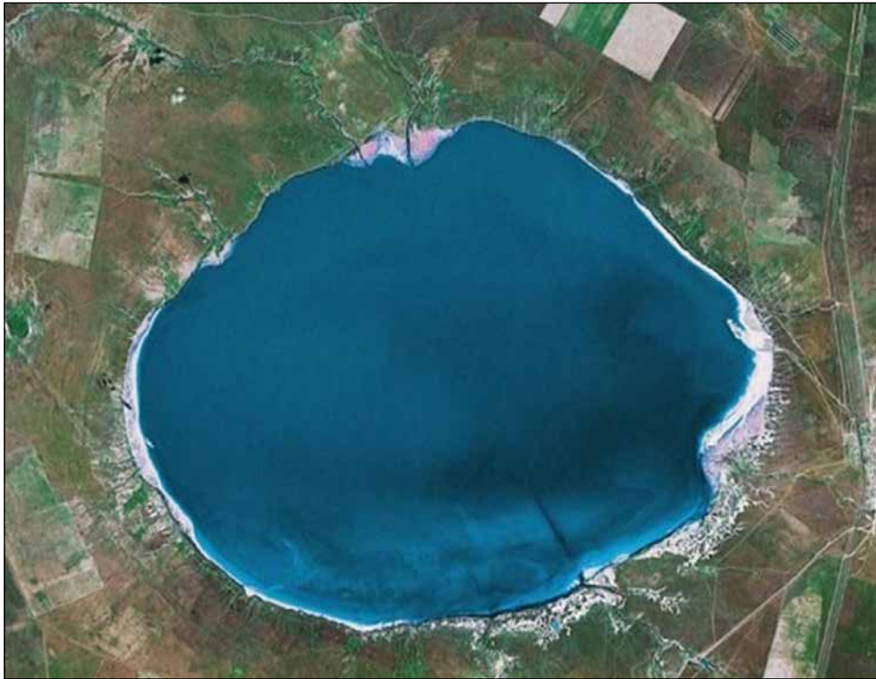
Озеро Эльтон на снимке из космоса

довала их «по всем химическим регулам». В результате оказалось, что «оную соль <...> соленой воде предпочесть надлежит; и хотя она соль сама собою не так чиста, понеже не литрована (очищена. — Е. М. ), как прочая употребляемая в России соль бывает, но однако ж солонее против сей имеет быть и морской соли — той, которая в других государствах находится, — не токмо равенством доходит, но и превосходит, и так собою без литрования к человеческому употреблению не вредна, а <...> без всякой опасности и повреждения в пищу и к солению мяса и рыбы полезна быть имеет».