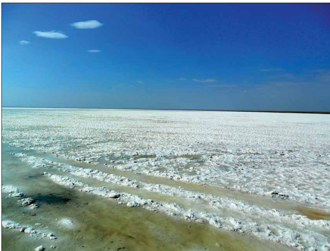
Озеро Эльтон. Современная фотография

Об организаторе казенной добычи соли на озере Эльтон Николае Федоровиче Чемодурове (?–1752)