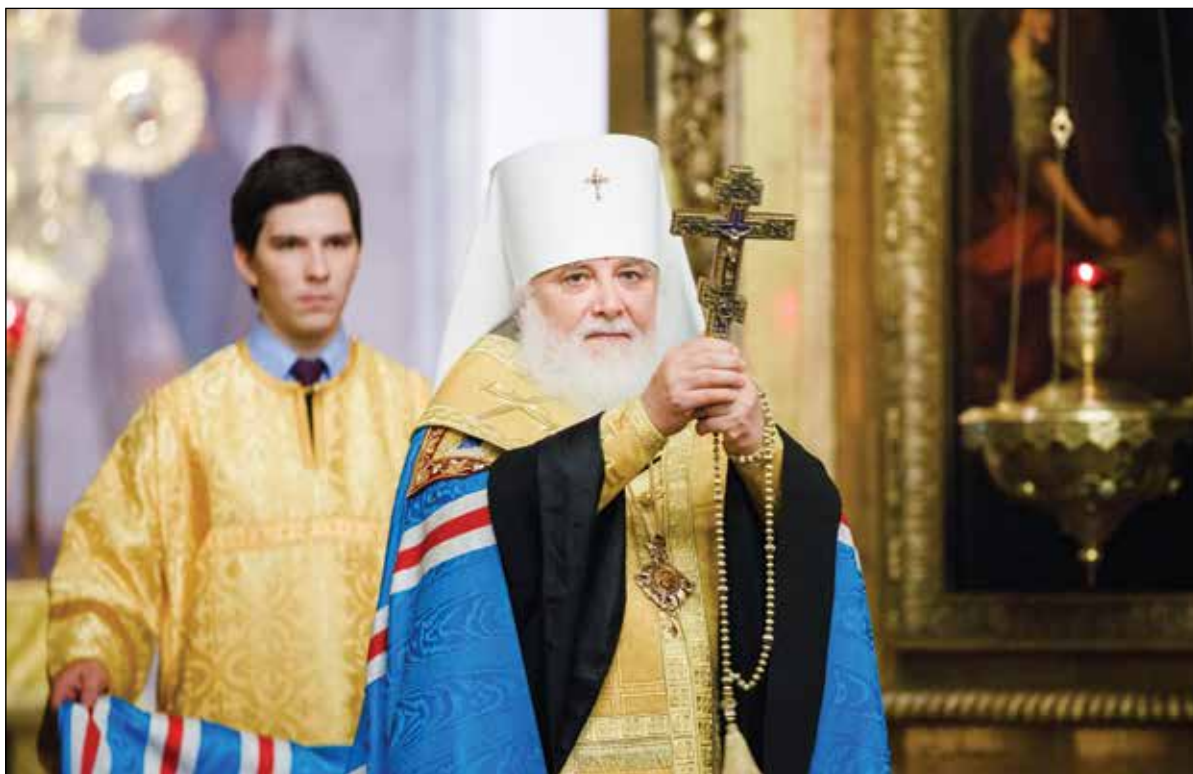
Благодарственный молебен совершает митрополит Истринский Арсений (Епифанов)