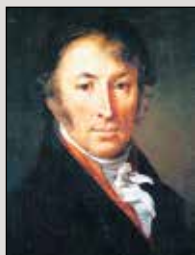
Основан Н.М. Карамзиным в 1791 году. Возобновлен в 1991 году

Литературно-художественный, историко-краеведческий журнал